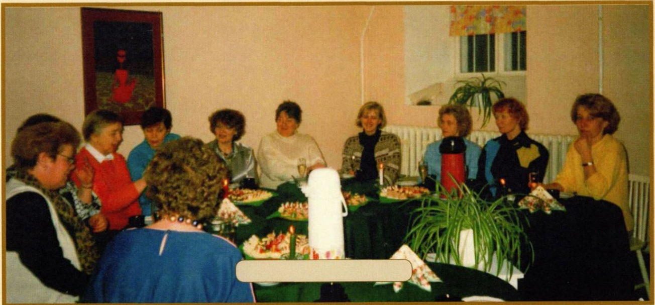
Selts registreeriti 09.1993.