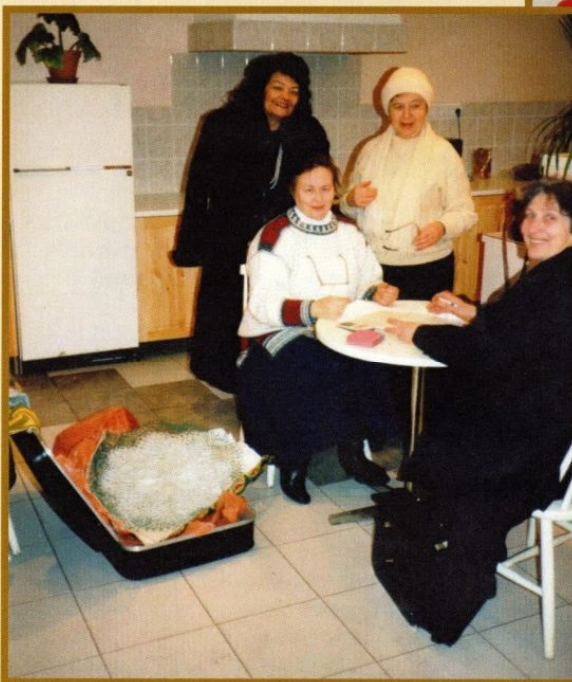
Ostetud 4 paari villaseid sokke ja saadetud Rootsi tänuks humanitaarabi vahendajatele 02.1999 Toetus UNICEF Eesti Rahvuskomiteele 1000.- sihtannetus Kosovo põgenike heaks 04.1999