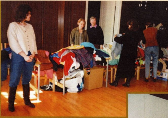
Soomemaa abi müügist teenime raha heategevuseks.