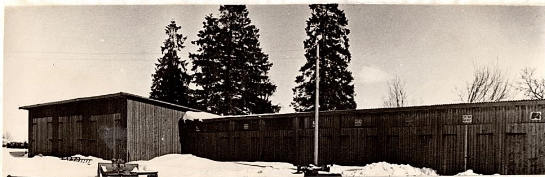
Kombainide ja traktorite koor. Ehitatud 1961. aastal.