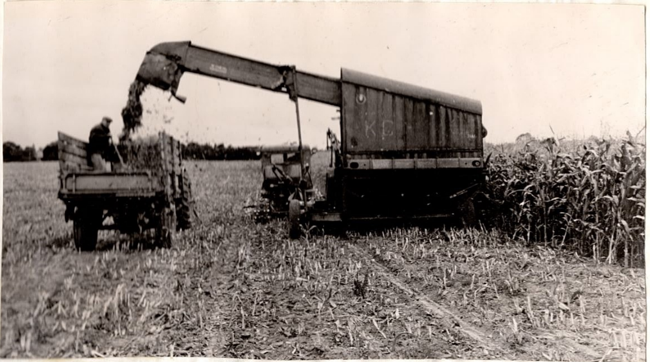
Saarese maisi mahavõtmine pole kerge töö.