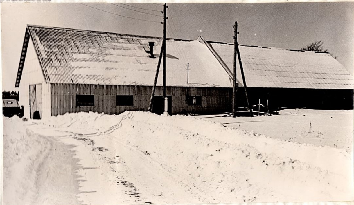
Trusselkuiveti. Valmistatud 1966. aastal.

Avaramate poldude ja drenaažikuivendusega heinamaade kasutuselavõtmisega võime otstarbekaselt ja julgesini tarvitada masinaid ilma nende katkestust kartmata, nagu se- da tihti juhtub väikestel heinamaalappidel ja kivistel poladel.