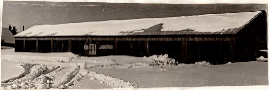
Pollutsariistade kaur. Tehtud 1965. aastal.

Juurde on tulnud palju uusi inimesi. Neist paljudki on põlisma jaanud ja töötavad kohalikele. Mitmed meist on saanud endale ilusa kodu.