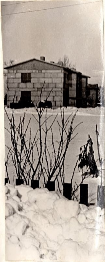
Pooleriiolev 8 korteriga elamu.

Meie majandi piirkonnas pole olnud mitte midagi ega suurtalu. Sellepärast ei parinud me ahista- misega mitte suuremat hoonet. Olig vaid keskmistalude karjaleuded, ku- hu paremal juhul võib mahutada 20-25 veist või hobust.