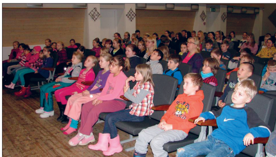
... ja publik kuulas