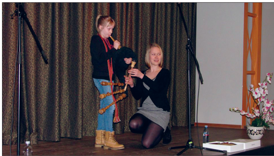
Merlin mängis ...