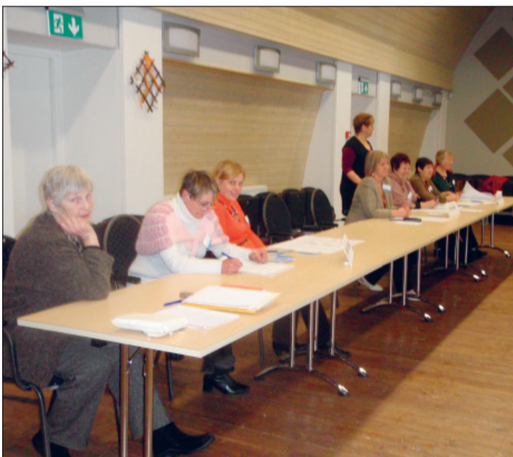
Valimiskomisjon kultuurihallis 2011. aasta Riigikogu valimiste ajal

Samas tuleb arvestada, et enamik kohti Riigikogus (viimastel valimistel 82 kohta 101st) jaotatakse kandidaadi isiklikust edukusest lähtuvalt. Siin ei ole määrav kandidaadi koht nimekirjas, vaid nad reastatakse ümber sõltuvalt valija poolt antud toetusest. Viimane osa kohtadest (viimastel valimistel 19 kohta 101st) läheb jaotamisele nn parteinimekirjade alusel. Ka siin on valituks osutumisel piirang – kandidaat peab mandaadi saami-