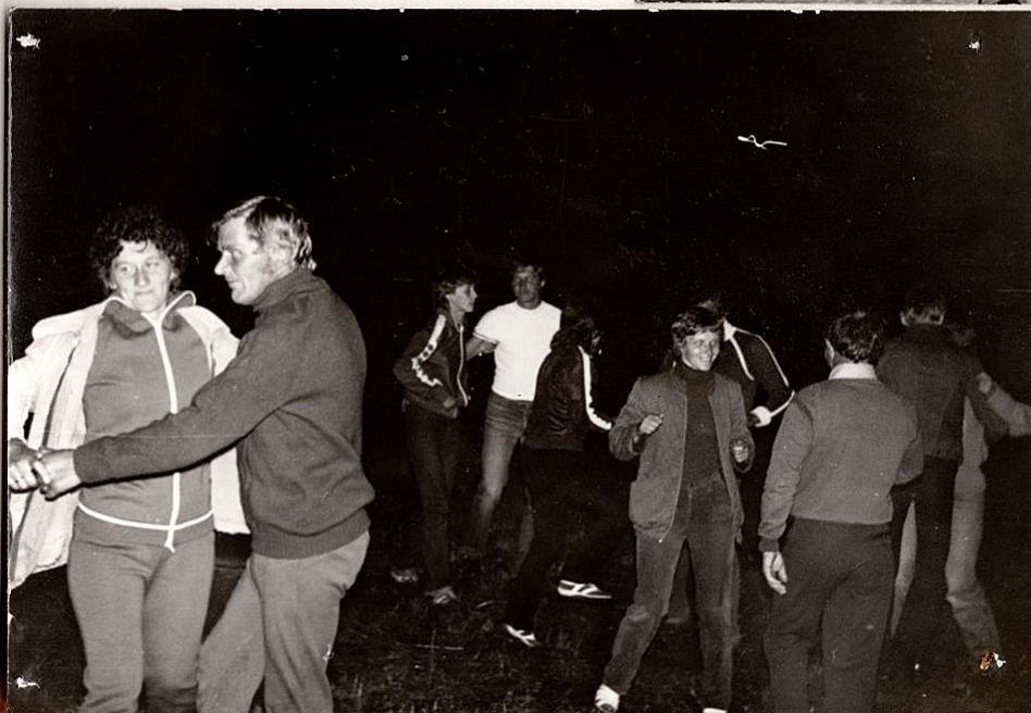
TANTS KUNI ÜLDISE VÄSIMUSENI. ← "OORAHU ÜLDISEL KOKKULEPPEL.