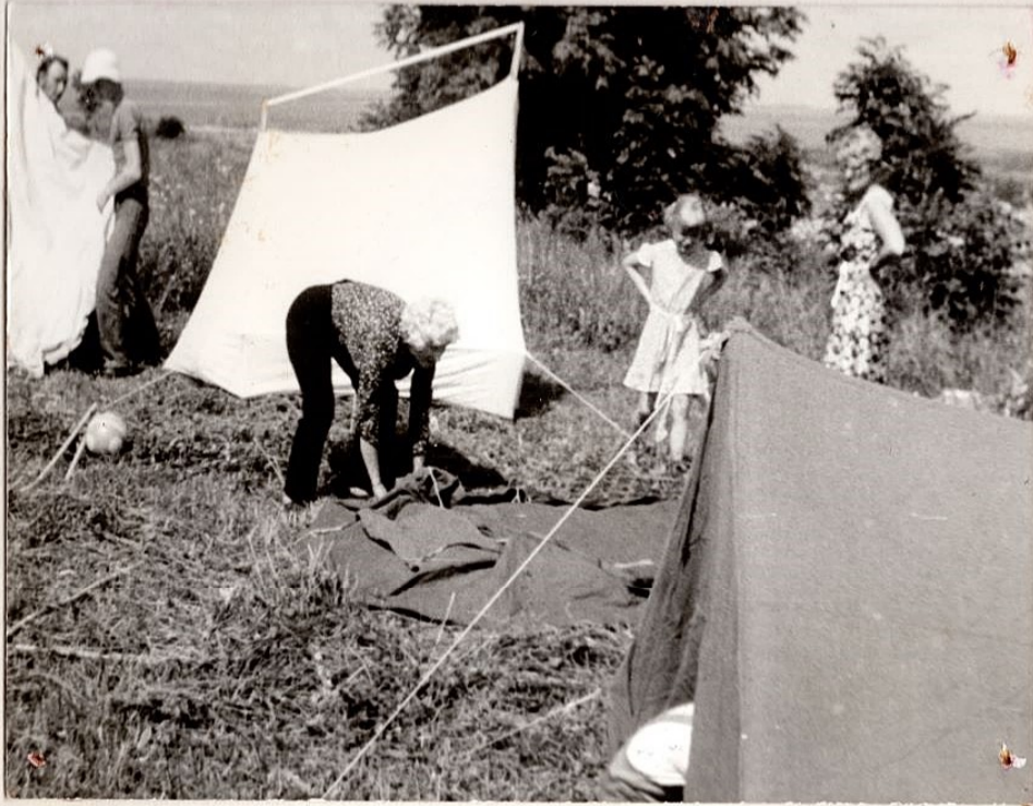
TELKLINNAK KADUS SAMA KIRESTI KUI KEREKIS.