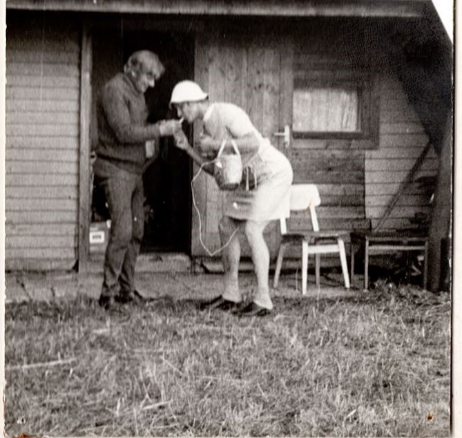
"KÄNNUÄMBLIKUD" TEEMAL: "MOOD LÄBI AEGADE"