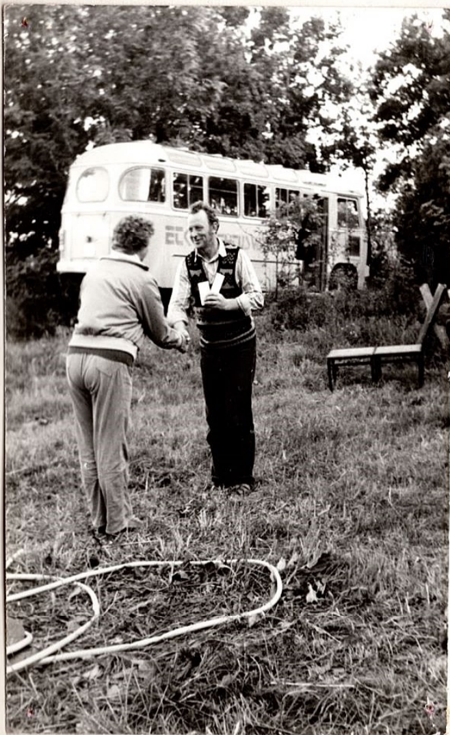
LAAGRI PARIMA PERE PEREEMA AUHINDA VASTU VÖTMAS.