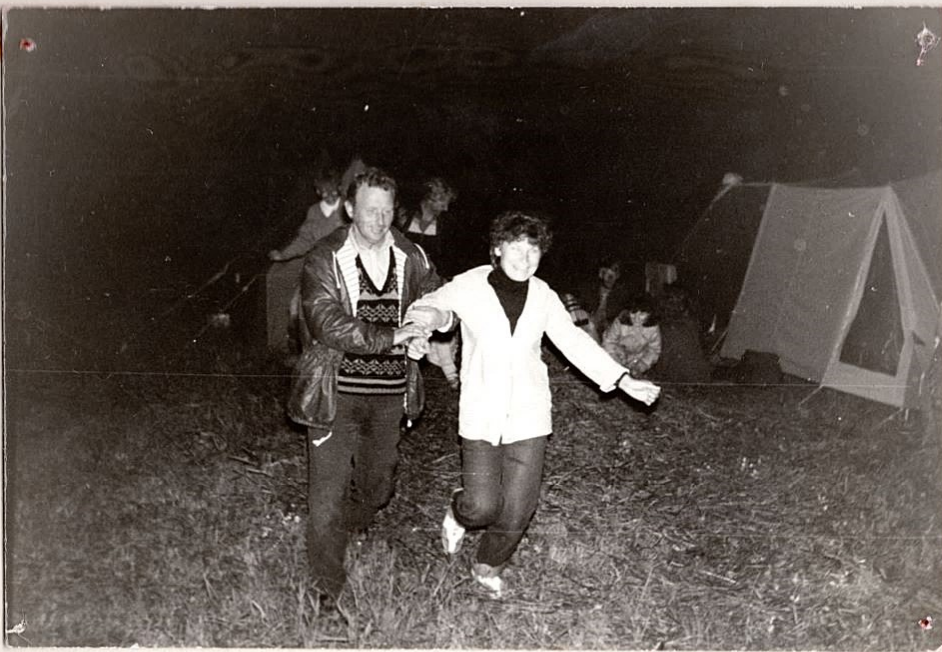
← "LAHME TANTSIMA