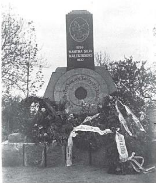
Nii nägi välja Mahtra sõja ausammas, mis avati 14. juunil 1933. Samal kuupäeval pildistas seda F. Reinberg.