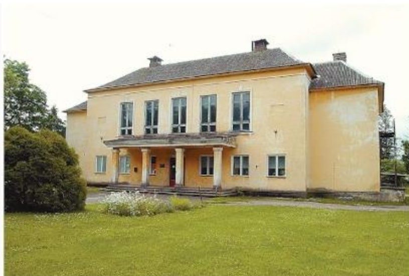
Mahtra sõja 100. aastapäevaks valmis Juuru rahvamaja.