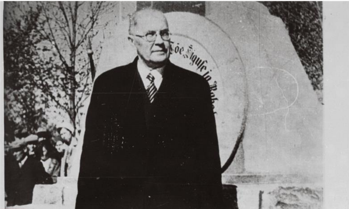
VIIMNE ESINEMINE: Rahvas nägi kirjanik Eduard Vildet viimast korda 4. juunil 1933, kui ta pidas Mahtra sõja 75. aastapäeval Mahtras kõne.