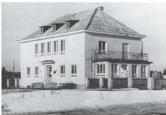
Mahtra sõja 100. aastapäeva paiku valmis Mahtras sovhoosi uus kontor-klubihoone. Foto on tehtud 1959. aasta talvel.