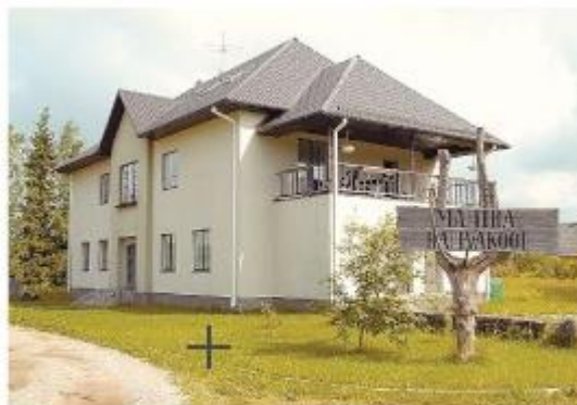
Mahtra rahvakool 2. juulil 2008.