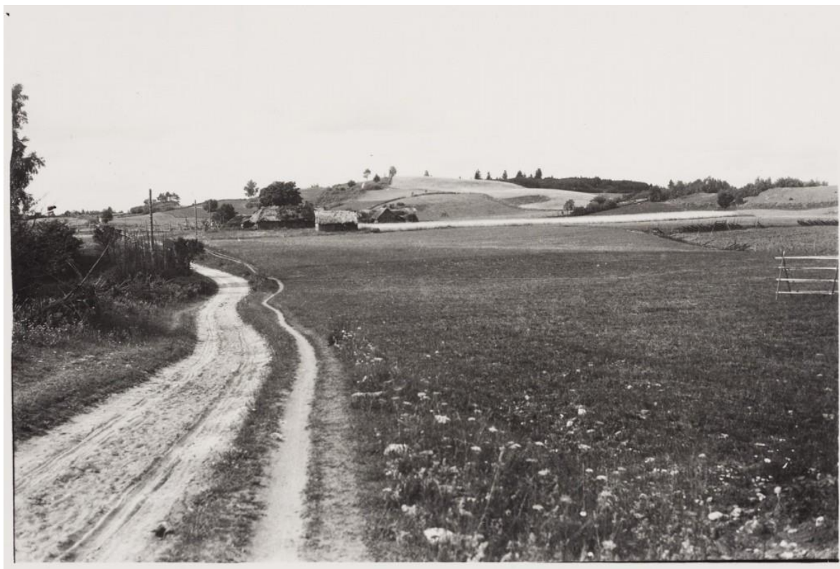
Pilt 1. G. Vilbaste. kogumikus "Kas tunned maad?"

Puhke- ja spordikeskuse territooriumile jäävas Palukülas elas 1959. aastal 113 inimest. Piirkond võeti looduskaitse alla väärtuslike ökoloogiliste ja geoloogiliste tingimuste ning mäe silmapaistva ilme tõttu 1964. aastal. Hoolimata looduskaitse tingimustest, eksisteeris 1960 – 1975 aastatel Paluküla Hiimäel kogu mäe ulatuses motokrossirada. Ametlikud motokrossivõistlused toimusid aastatel 1960 – 1964, mistõttu võeti mägi kaitse alla, kuid elanikud mäletavad motokrossivõistlusi Reevimäe tipus kuni 1974. aastani. Reevimäe nõlval on ulatuslik tehniline kahjustus, mis on tekkinud kaevandamise tagajärjel.