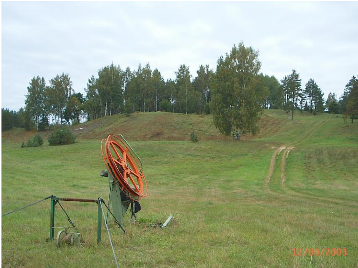
Pilt 3. Mäetõstuk. A. Hindremäe

Huvirühmade tagasisidega arvestamata jätmise tekitas olulist pahameelt. Kohalike sõnul ei olnud Paluküla Hiimägi enne vaidluste teravnemist pühapaigana regulaarselt kasutusel, ent pärast konflikti puhkemist 2003. aastal hakkasid Maavalla Koja liikmed korraldama mäe peal palvusi (tavaliselt novembris ja jaanuaris). Maavalla koja liikmed algatasid allkirjade kogumise kampaania “Paluküla Hiimäe kaitseks!”, millele koguti üle 10000 toetusallkirja. Allkirjutajate seas oli riigikogu liikmeid ja tuntuid ühiskonnategelasi. Lisaks allkirjakampaaniale korraldati toetuskontserte, kirjutati artikleid, valmistati lühifilme, kaasati eksperte, teadlasi ja ametnikke riigiasutustest (Keskkonnaamet, Muinsuskaitseamet, Looduslike Pühapaikade Ekspertnõukogu, Riigikogu looduslike pühapaikade toetusrühm), moodustati mittetulundusühinguid (Paluküla Hiimäe Hoiu Seltsing MTÜ) jpm.