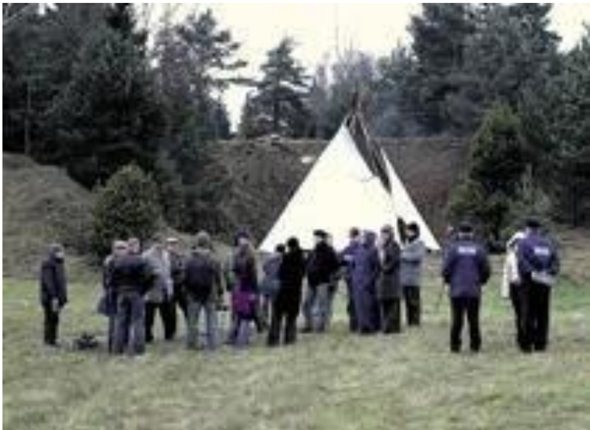
Pilt 4. Püstkojad Paluküla Hiemäel. A. Hindremäe

Avalikust survest tulenevalt võetakse 2003. a novembris Hiemägi ajutiselt muinsuskaitse alla.