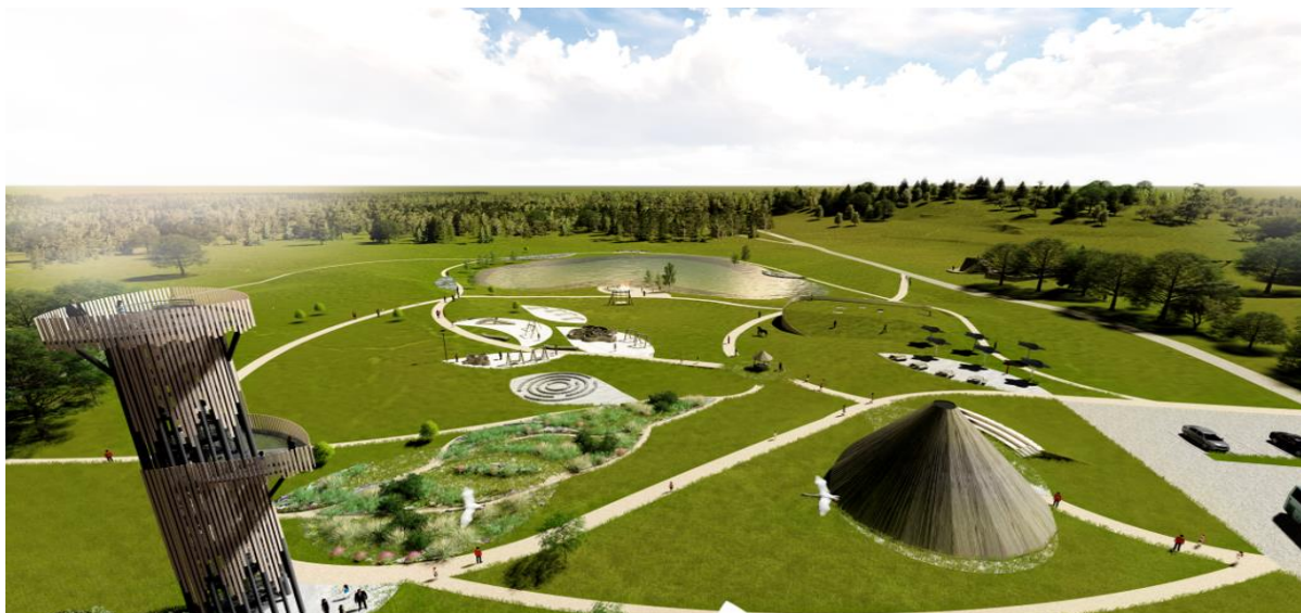
Pilt 5. Haldjamaa projekt. Väljavõtte esitlusest. Autor. Paluküla Klubi MTÜ.

Kehtna Vallavalitsus kuulutas välja väikehanke riigihangete registris 07.01.2021 (hanke viitenumber 231580). Hanke tulemusena sõlmiti hankeleping 12-2/2021/12 perioodiks 25.02.2021 - 24.01.2026, võitja MTÜ Lumider . Omavalitsuse halduskulu kinnistu ülalpidamist enne hankemenetlust oli 2020. aastal kokku 9999€.