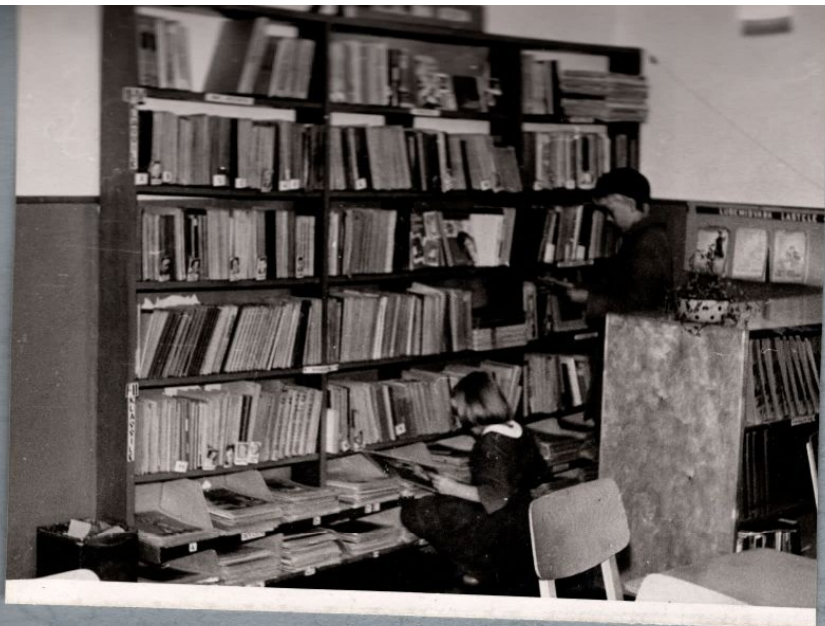
Oma käega valin ise endale meeldiva raamatu