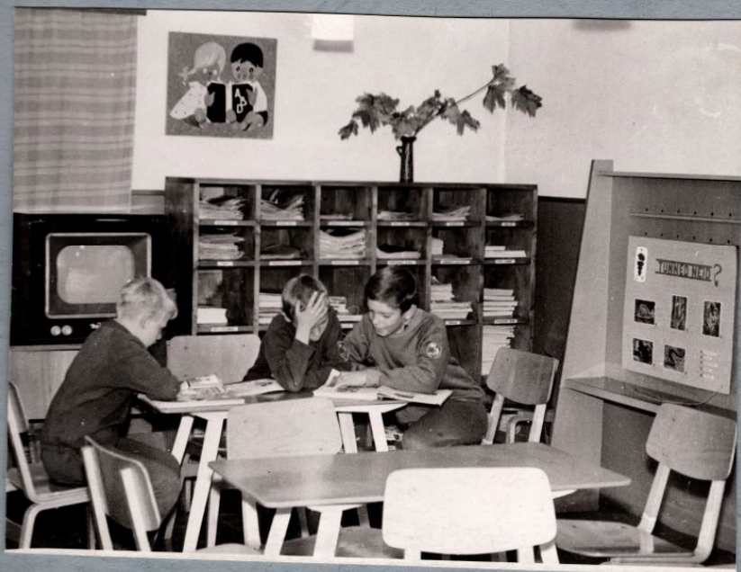
Ajakirjades on palju uut ja