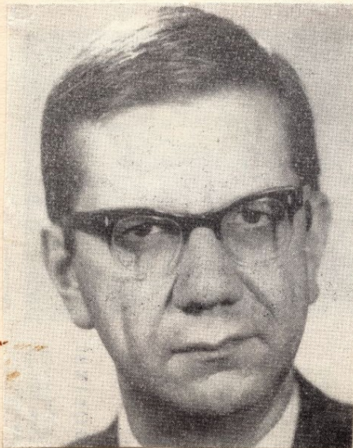
LASTEKIRJANIK ENO RAUD

9. mail külastas Märjamaa Lasteraamatukogu poolt organiseerituna Märjamaa Keskkooli õpilasi lastekirjanik Eno Raud. Kohtumine möödus huvitavalt ja lapsed lahkusid sellelt õhtult toredate muljetega.