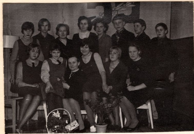
Pildil: vasakult paremale

Raamatusõprade ringi vanema rühma (VII-VIII kl) liikmetega korraldasime «Aava tädile» lahkumisõhtu ning ringis toimis ka pereheitmine. Lasteraamatukogu juurde jäi tööd jätkama noorem raamatusõprade ring (nüüd juba VI kl. õpilased)