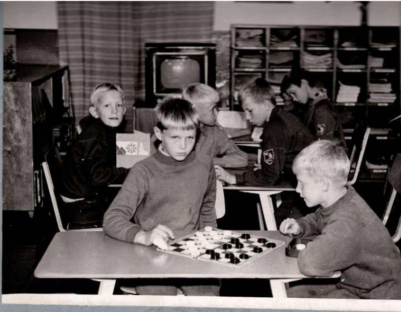
Harjutamine teeb meistriks