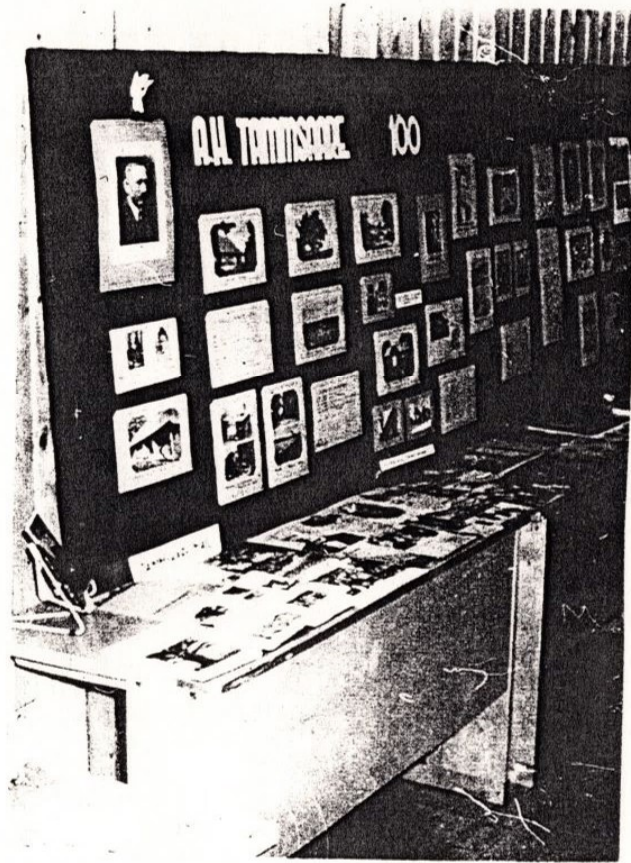
Näitus Valtu 8-kl. Kooli eesti keele ja kirjanduse kabinetis.