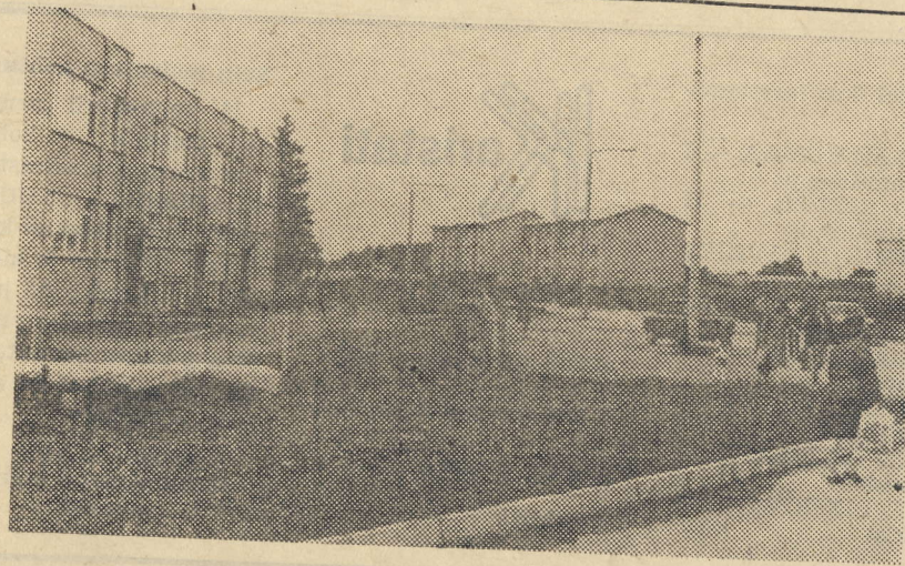
● Metsapargi tänavas on valmimäs uus 24 korteriga elamu meie töötajaille. Majas on kõigi mugavustega 2-, 3-, 4- ja 5toalised korterid. Lasteaed jääb kiviviske kaugusse.

Pääsmed müügil kultuurimetoodiku juures.