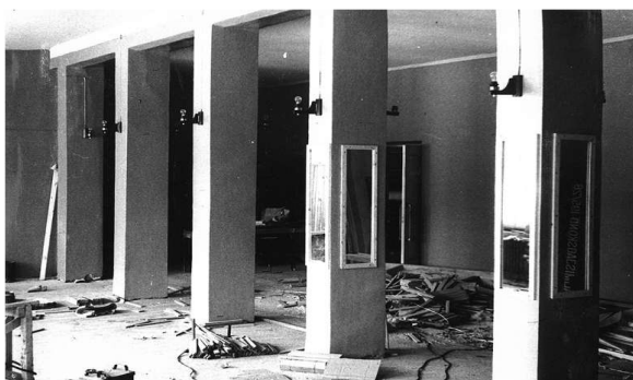
Märjamaa kultuurimaja jalutussaal 1974. aastal.