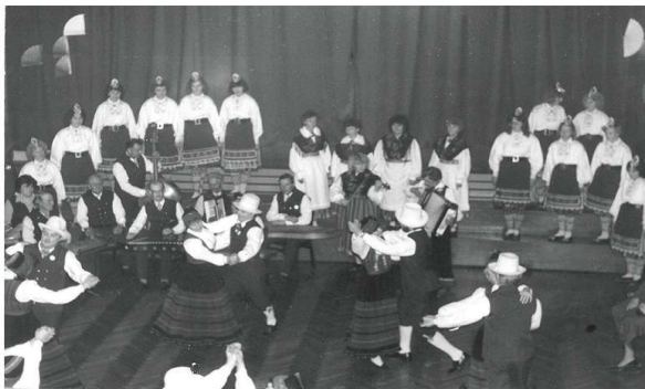
Rapla rajooni taidlusfestivali lõppkontsert Märjamaa rahvamajas 1987. aastal

Kuidagi ei kao meelest viimane venestamise laine Eestimaal, mis toimus vahetult enne Nõukogude Liidu lagunemist. Rap-lasse tuli parteikomitee esimeseks sekretäriks Silvi Mets. Kaks kindlalt toimunud