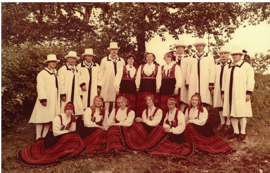
1980. a tantsupidu. Ly tammel ja rahvamaja segarühm.

kätte ja saatsime tagasi. Mõne aja pärast ta naasis, isa kalosid jalas. Meile tegi see nalja, et alevi autoriteetse mehe poeg näitab, mida ta võib endale lubada. Saatsime ta jälle koju. Lõpuks tuli ta peole kingades, ja minul on tore seda pool sajandit hiljem meenutada.