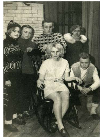
Diplomilavastuse „Minu armas kriitik“ trupp.