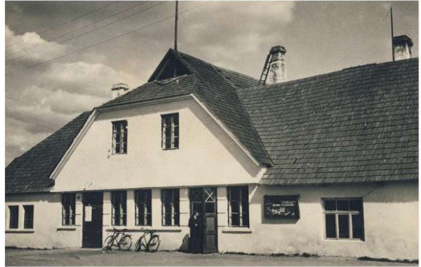
Märjamaa alevi kultuurimaja aastal 1950.