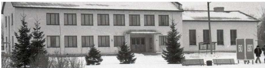
Märjamaa kultuurimaja 1977.