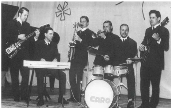
Populaarne bänd oli Caro.

teringide õpitud üle vaatamas. Kõikides rahvamajades toimusid ettemängimised, neist meelde on jäänud kaks. Valgu rahvamaja tegutses Valgu mõisas, seega Valgu põhikooli hoones. Hiljem ehitas Valgu sovhoos klubihoone, mis toimis aastakümneid. Sellel sajandil müüs Märjamaa vald oma halduses oleva hoone.