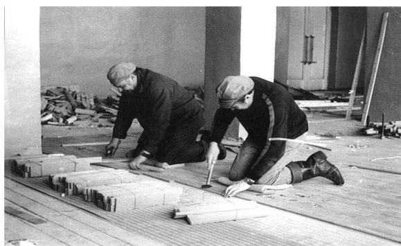
Märjamaa kultuurimaja remont algas 1974. aastal.