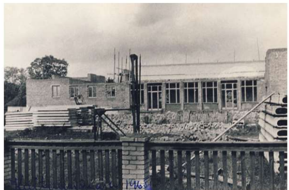
Märjamaa kultuurimaja ehitus 1965.