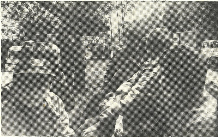
Ühtesid paelus troskasõit, teisi autode vigurvõistlus

Sovhoosi juhtkonna ja ühiskondlike organisatsioonide infoleht nr. 5 august 1989