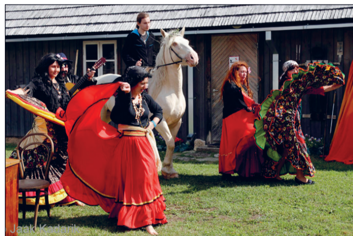
Emotsionaalne mustlasosa etendusel

Alles siis, kui esietendus oli saanud suure aplausi, kõik