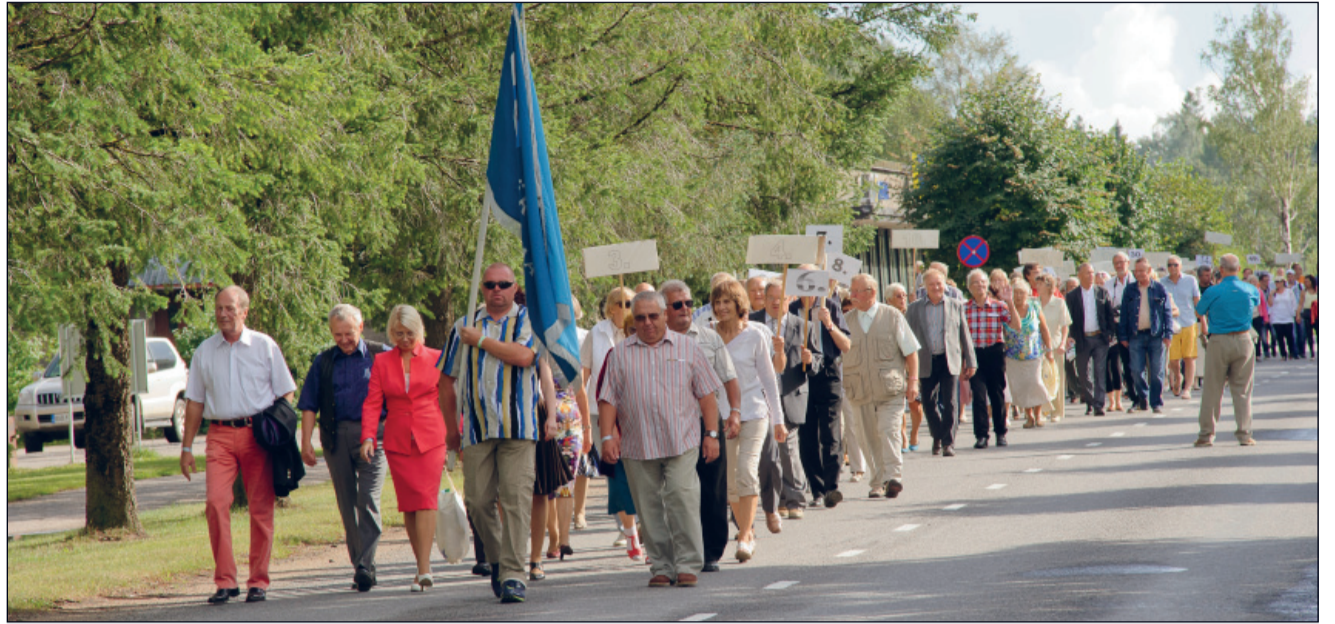
Seekordne rongkäik oli toredalt rahvarohke

Alles siis, kui esietendus oli saanud suure aplausi, kõik