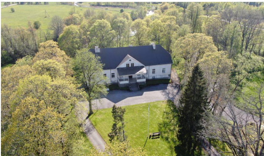
Teenuse mõis, kuulub Märjamaa vallale

► Video https://menu.err.ee/598667/aasta-kula-2017-kandidaat-teenuse