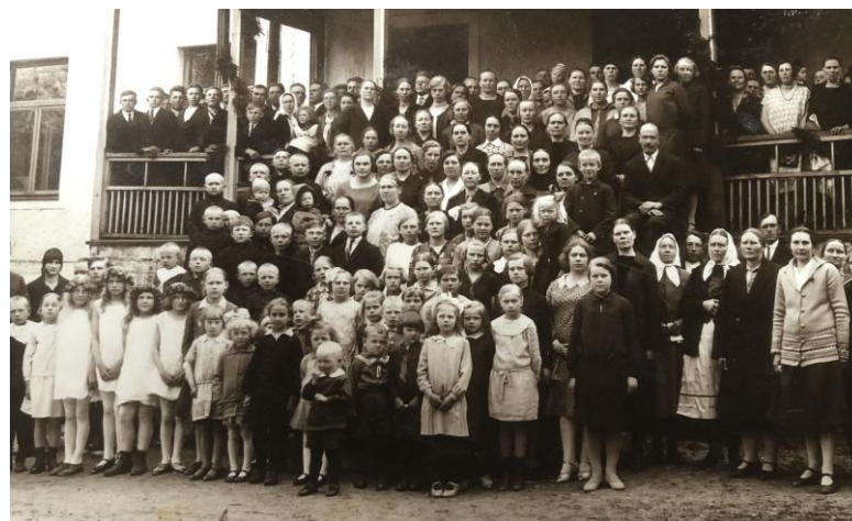
Teenuse kool, emadepäev 1926 ..ja Teenuse kooli õpilased, 1990ndad