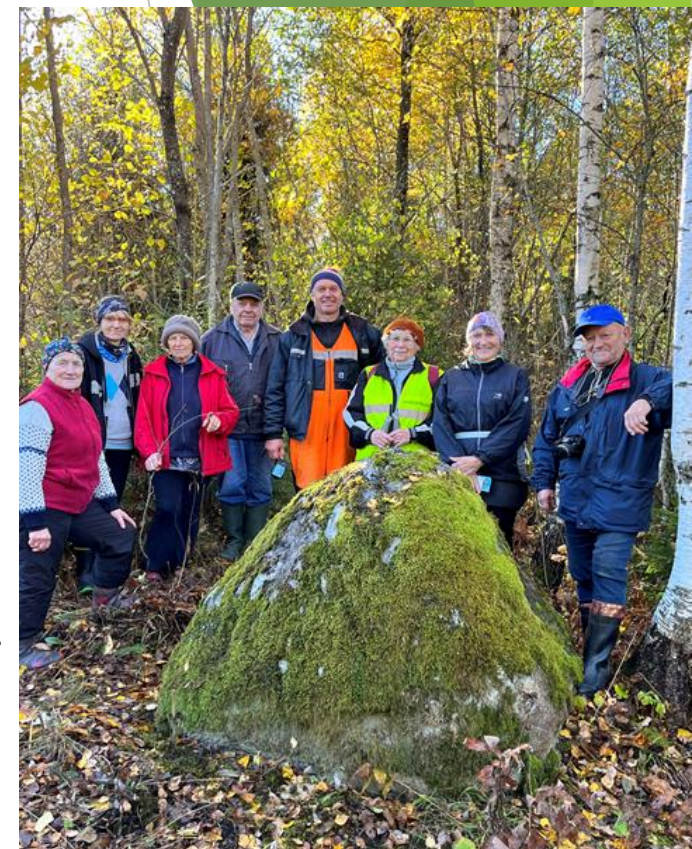
9. oktoobril 2022 kolme härra piirikivi juures