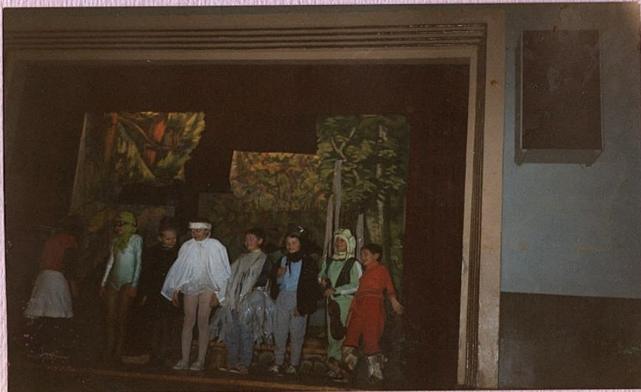
deti. 1995 lastinõudend "Lusk ja Vesirõõg"