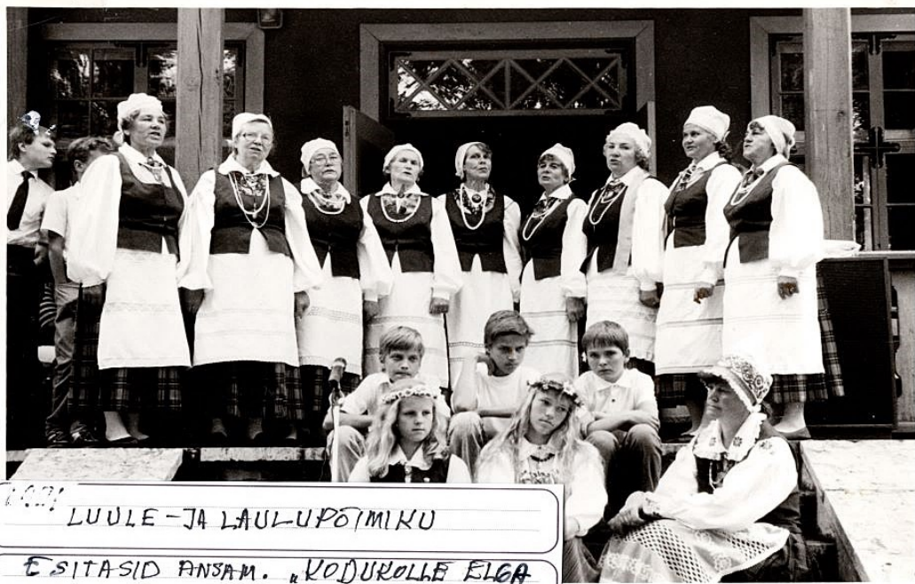
1991 LUULE- JA LAULUPÕTMIKU ESITASID ANSAM. "KODUROLLE ELGA HIIOBI JUHATUSSEL JA KODILA KOOL LAPSID"