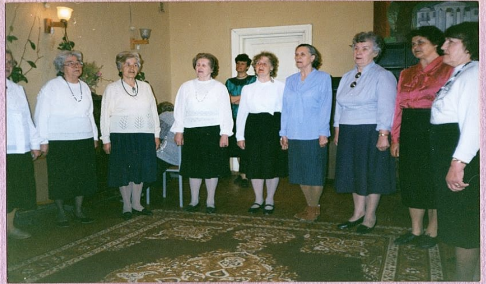
Pensionäride "Kodukolle" kontsert and ma Kõhu Hoddekodu) 1996

Väga väga ras nervad 1994 härte võngede inamõnna kõnnukile