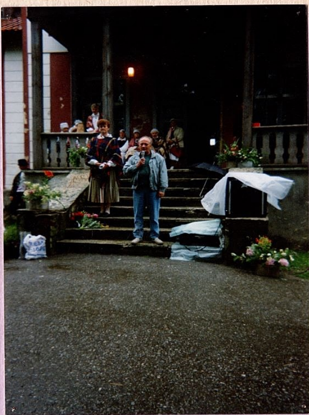
Joone päev 1998