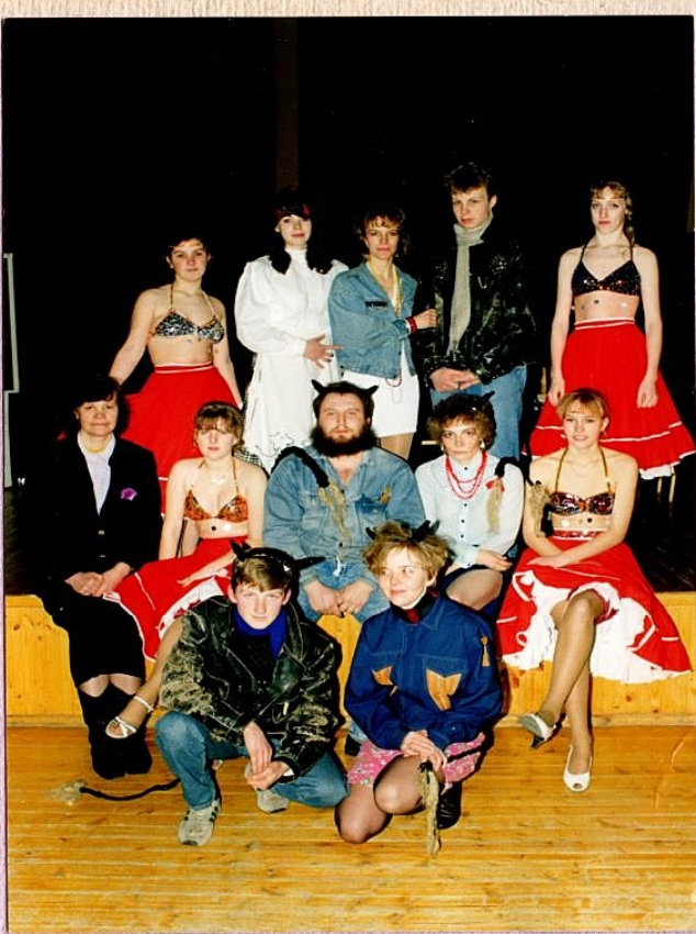
Værelaps ja kalula tar

Väga väga ras nervad 1994 härte võngede inamõnna kõnnukile