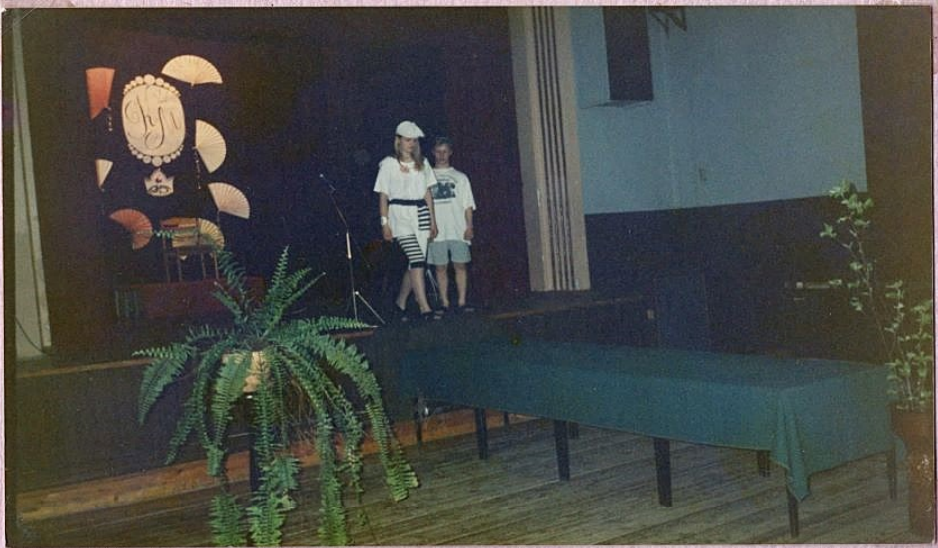
1996. Kodile kooli missi ja mitmed neliklassid