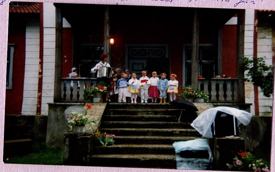
Soaniste kooli laste ja õpetajate õnnelikele