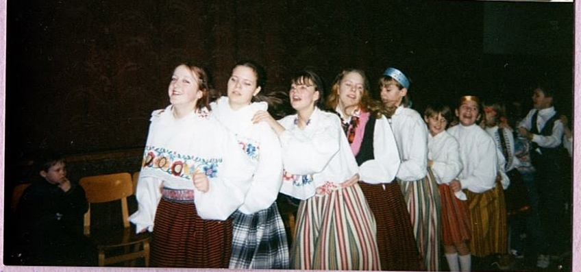
Õnne, Inall 99 kooli õpetajate võistlus