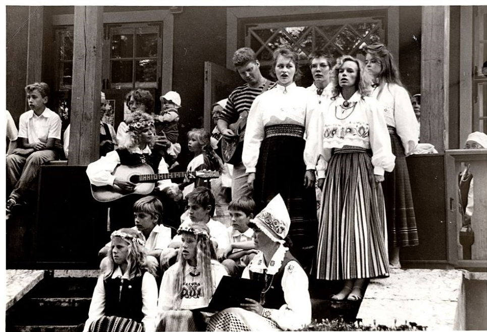
Pidu lõppes lauluga mäisa trepi ees asfaldil