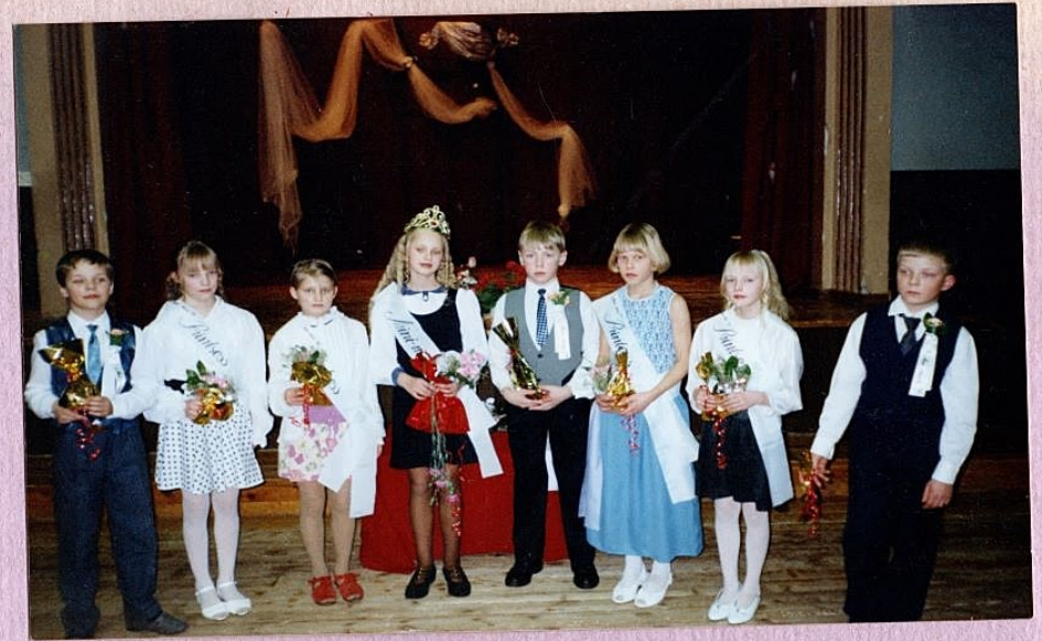
Levadep 1999 valitud meesõnnimiss ja naised