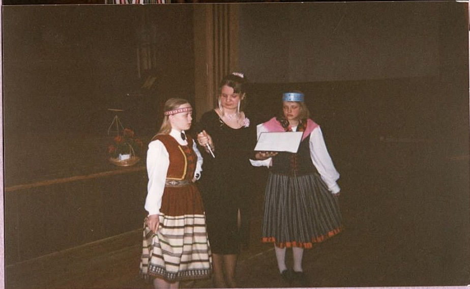
Liisvi rādē omā se kitted 1998 (aalvaride 1907)