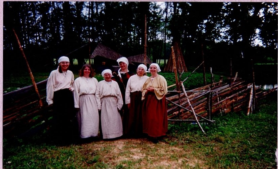
Juta Blonda mās grupi folkisomaže kēfatej Juurus Maltza soja 140 ap. etendis 1998