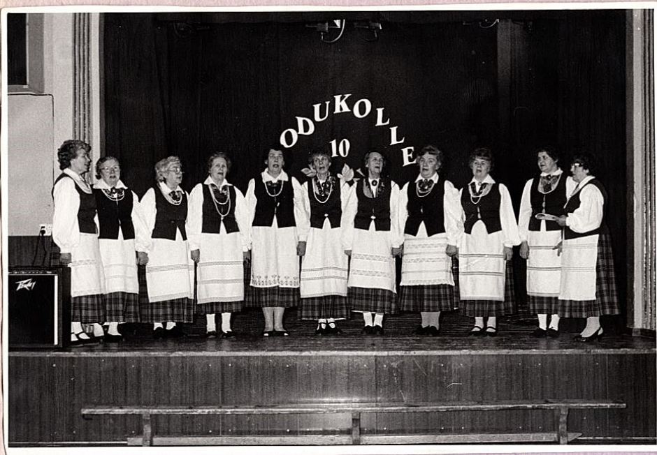
28. veebr. 1997. tähistas ans. Kodukolle 10. aastapäeva.