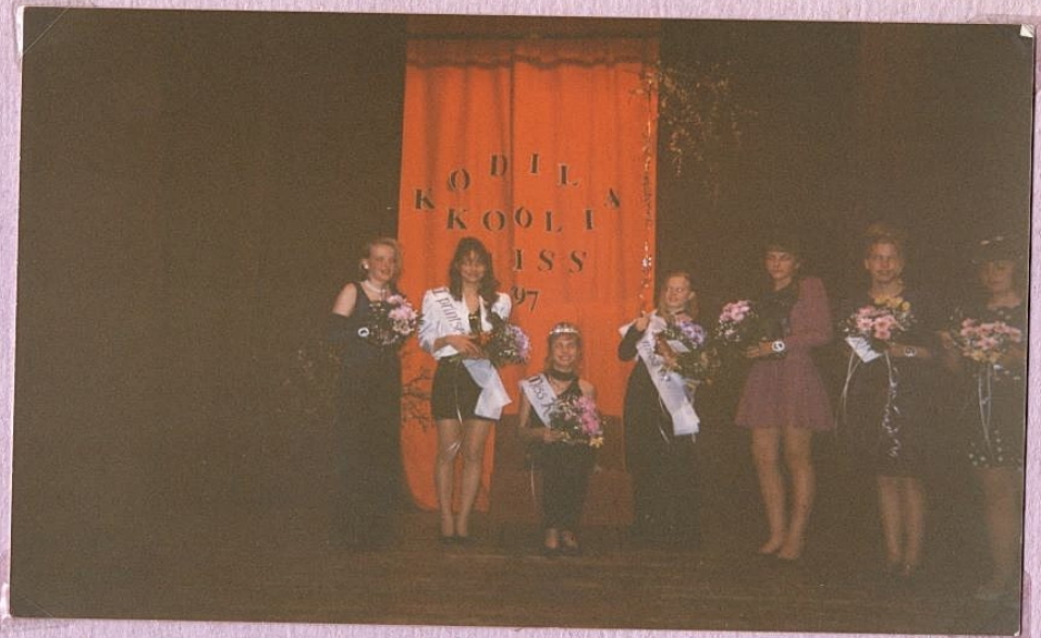
Missi ja neliklassid 1997