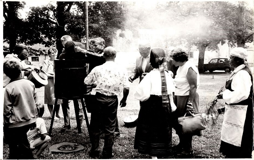
1991. juuli. 1991. tähistatakse kodile esmamajutamisest 150. aastapäeva. Tõdemõeldi tule kinnituseks (Külade vabatahtlikud teinud ette kodumajutusest tule, millest kinnituseks tule kinnituseks)