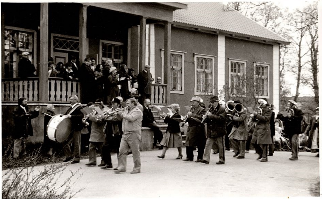
25. mai. 1991. Jaanipäeva tähistamiseks pidu Kodu ja Stadioni