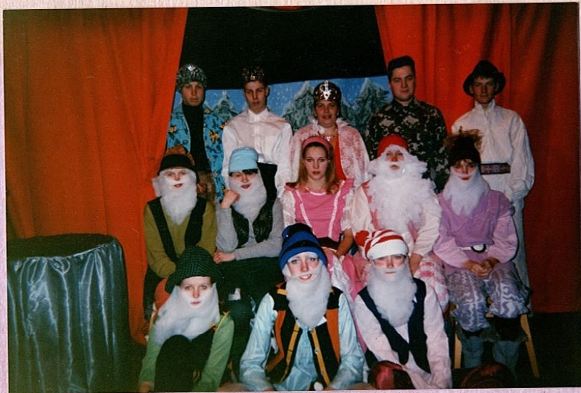
Kitzbergi üritused "Lumivalgus ja 7 põidpoissi" esietendus