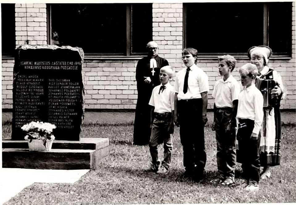
24. juunil 1991 avati meel. juures langevatele n. n. & look saab auordiduse naiste ansamltit, kopta kogudise õpet. & perekala