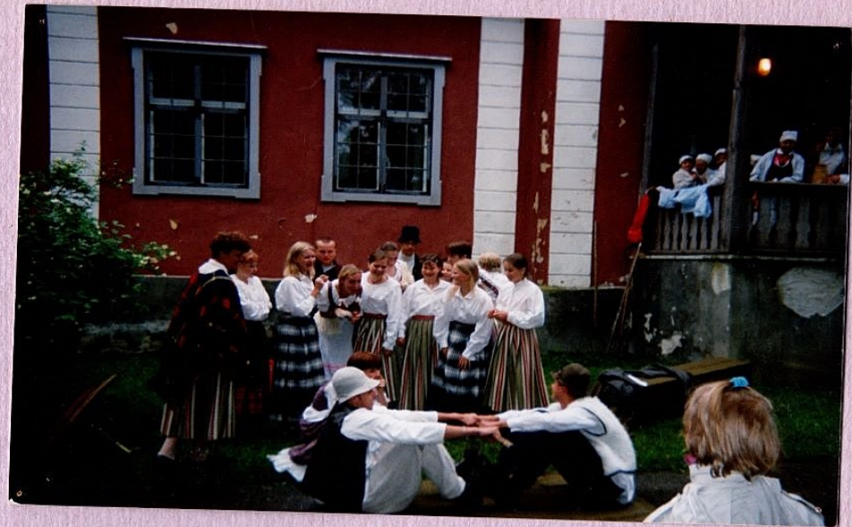
Õnnelikele ja kooliõpetajatele sünnipäevade ja kooliõpetajate õnnelikele