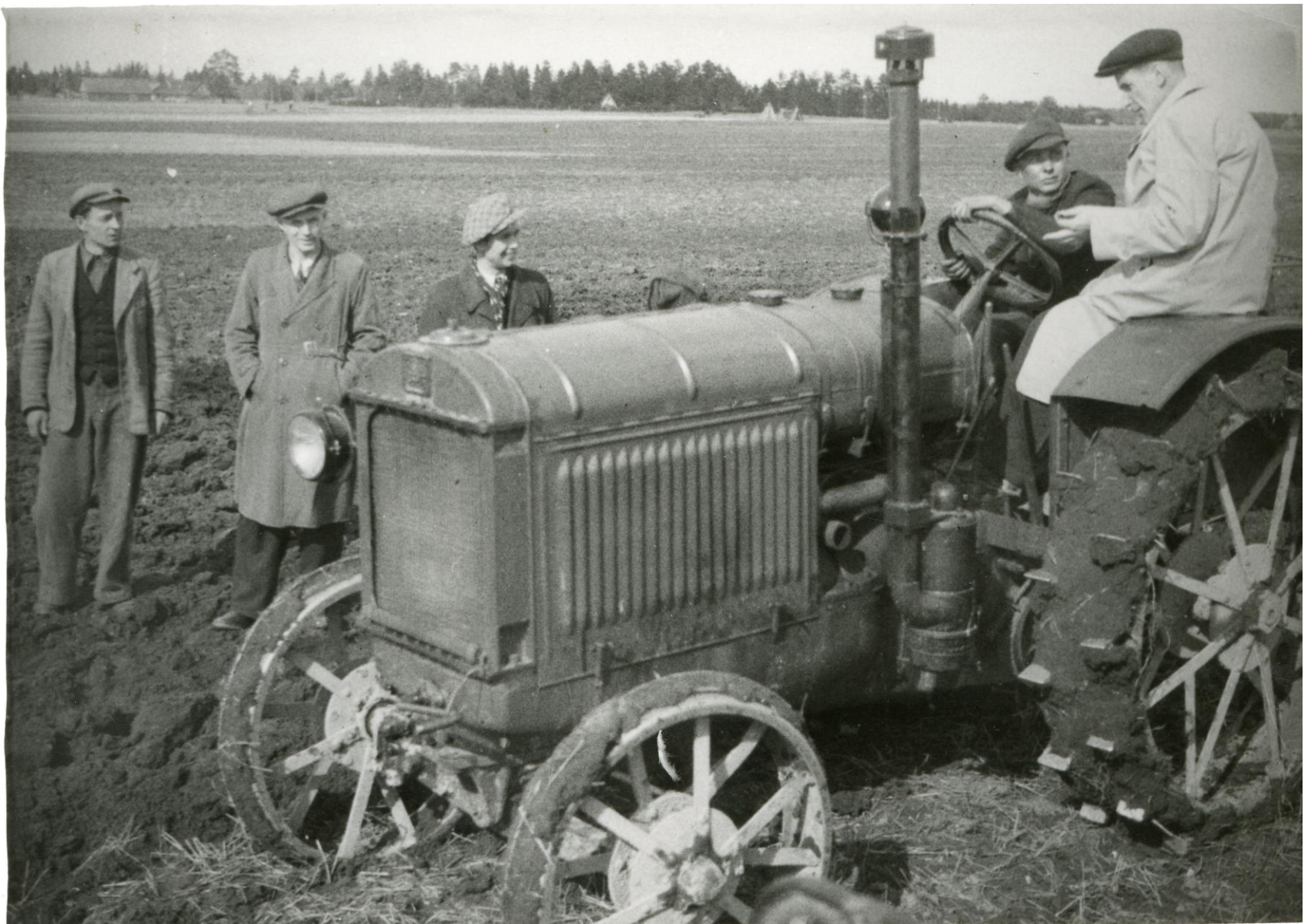
Asjamehed õpetavad MTJ mehi Kiviõli Uue Elu kolhoosis kündma 1949