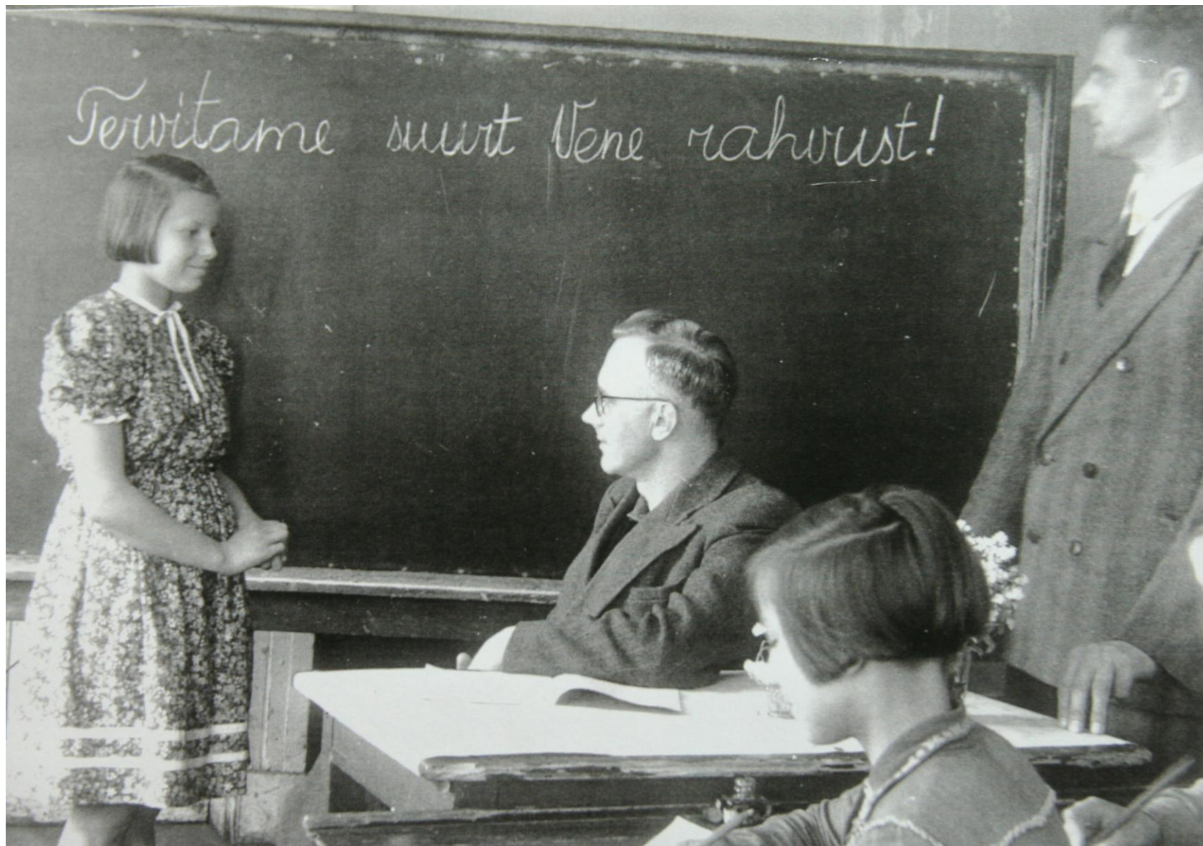
Koolis tehti lastele kohe selgeks, kes on nüüd siin peremehed. Koeru 1950. aa