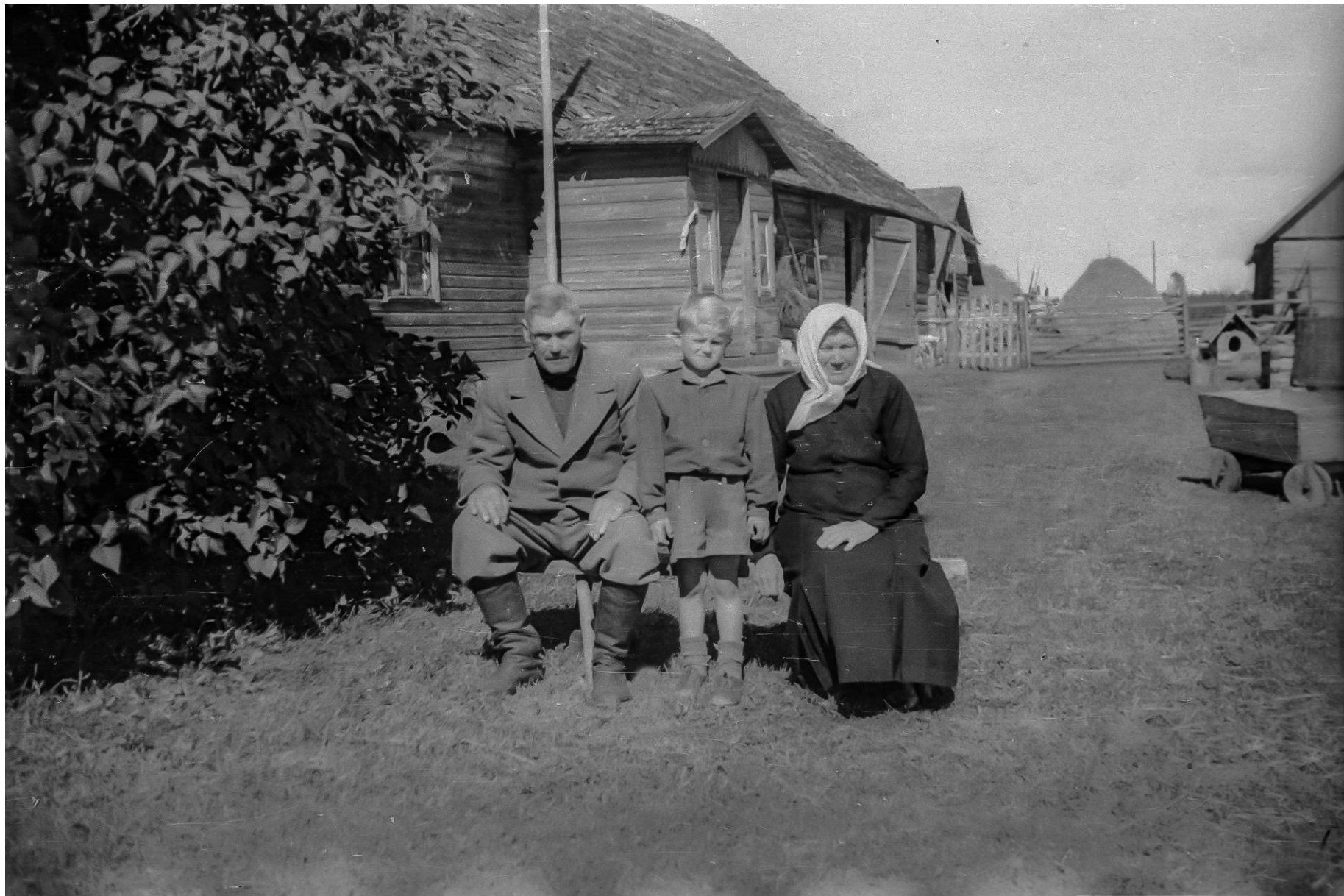
Üks tavaline Eesti talupere Kaansoos 1946