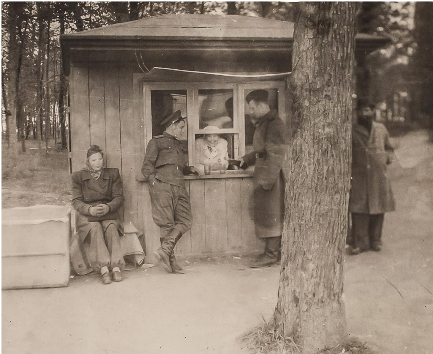
Alkoholimüük on üks lihtsamaid viise riigikassa täitmiseks. NSVLiidus tehti seda eriti agaralt pärast II maailmasõda – igal sammul leidis joogiputkasid, kus sai püstijalu visata 100-200 grammi viina koos väikese „sakuskaga“. Põltsamaa 1946 .