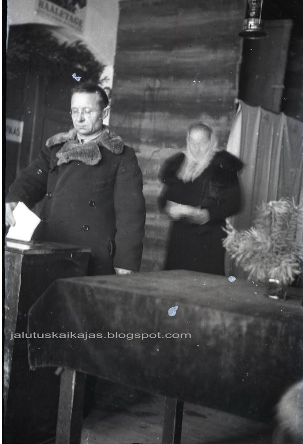
Kohalikud valimised Rasinäs 1948