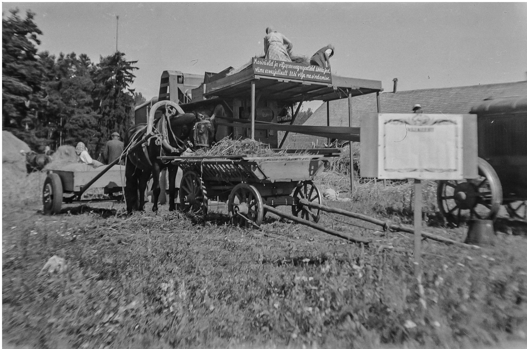
Ilma mõttetute loosungiteta ja kihutustööta ei saanud kolhoosis teha vist ühtki tööd. Võimsa Jõu kolhoos Rannus 1951.