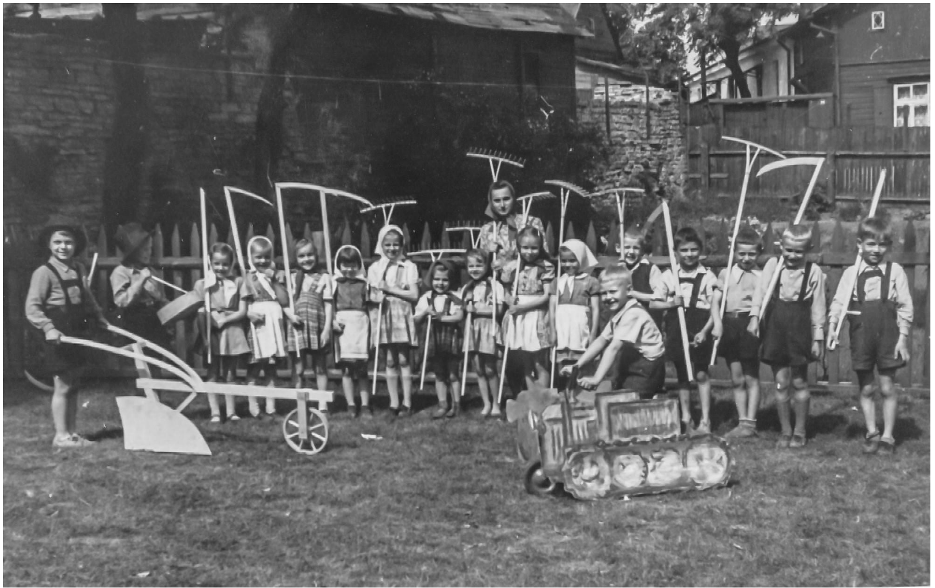
Lapsed Tallinna 10. lasteaias kolhoosi mängimas 1948