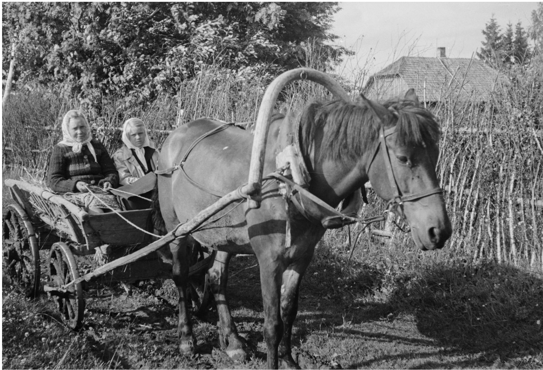
Kolhoosil oli päris palju lisäülesandeid, mida varem oli korraldanud vald, üks lisakohustusi oli postivedu. Rannu 1951