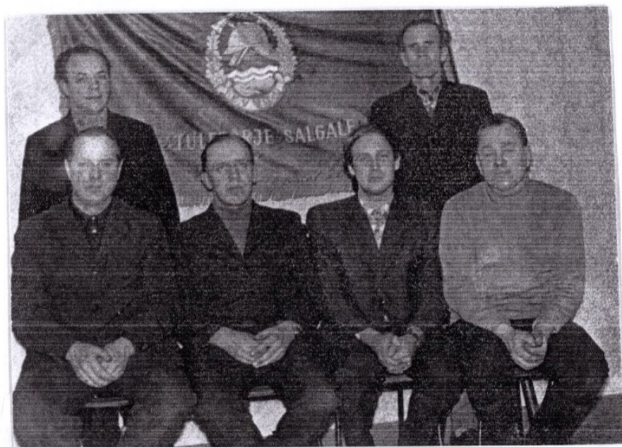
Valgu soovoo tulekorjalisalk 1981 a. Viideti majooi raudlipu all.