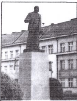
ПАМЯТНИК В. И. ЛЕНИНУ