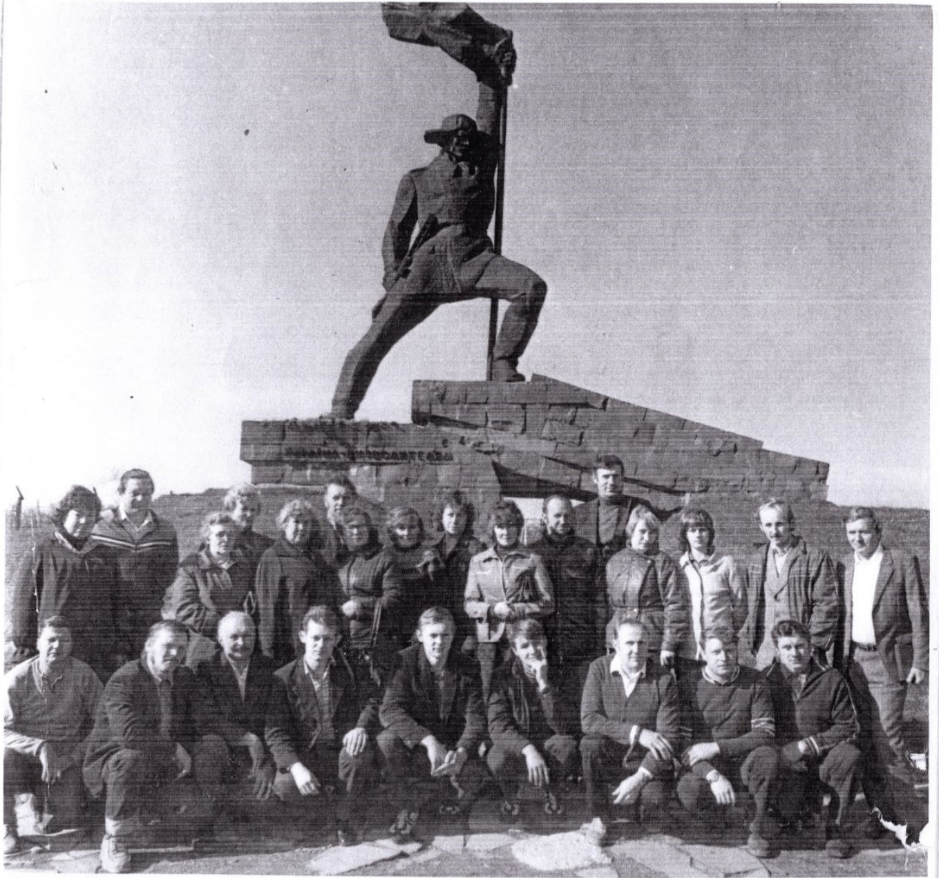
« УКРАИНА – ОСВОБОДИТЕЛЯМ » ПАМЯТНИК НА ГРАНИЦЕ СССР – ЧЕХОСЛОВАКИЯ ГОРОД УЖГОРОД