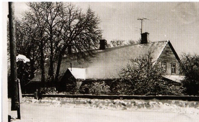
Apteegimaja Raplas avati 1866.