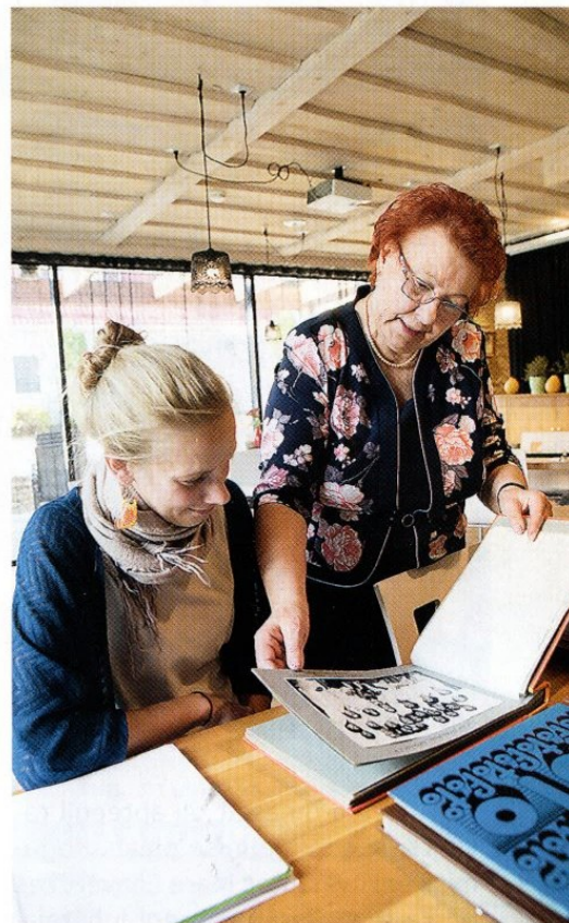
Sirvime pildialbumeid , mida Viivil oli intervjuule kaasa võetud terve suur kuhi.

Alevi kasvades suurenes ka haigla töömaht ning vajaminevate steriilide arv ja kiirustades tuli ette ka ohtlikke olukordi: „Esimest autoklaavitäit välja võttes lõhkes mul glükoosilahuse pudel ja otse vastu silmi. Prillid jäid küll