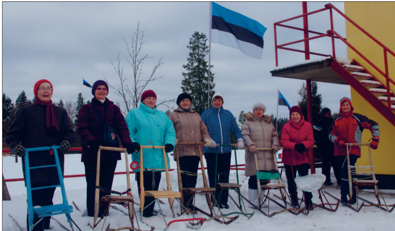
Kelgutajad vabariigi sünnipäeval