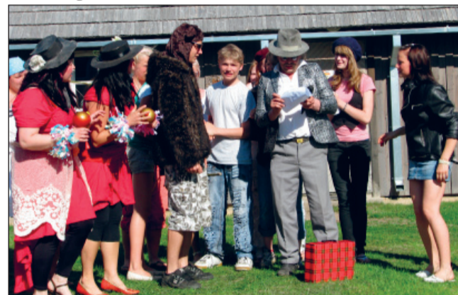
Hetk 2009. aasta perepäeva näidendist