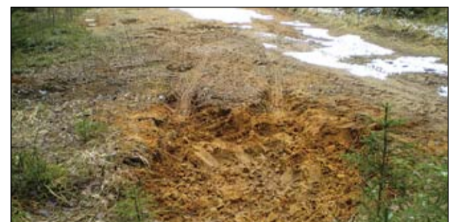
Rajale on viimastel nädalatel kaevatud ka ohtlikke süvendeid: ihe laskumise alumisse otsa tekkinud omaalgatuslik "liiva-karjäär", mille juures ka selgesti nähtavad traktorijäljed.