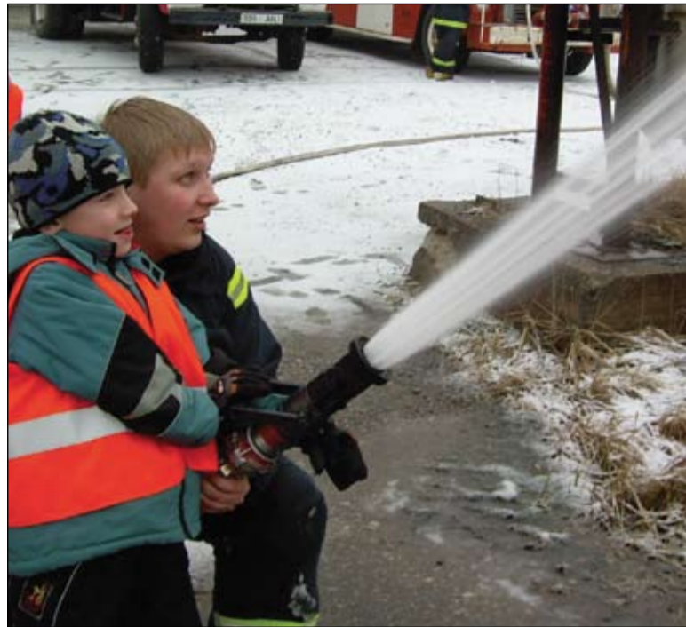
Lapsed võisid end tunda päris ehsate tuletõrjajadena.

Kui kogu vesi oli paagist välja lastud ja lõuna hakkas juba kätte jõudma, tuli hakata lasteaiapoole tagasi liikuma. Andsime üle tänukaardi sooja vastuvõtu eest ning tegime rohkesti fotosid.