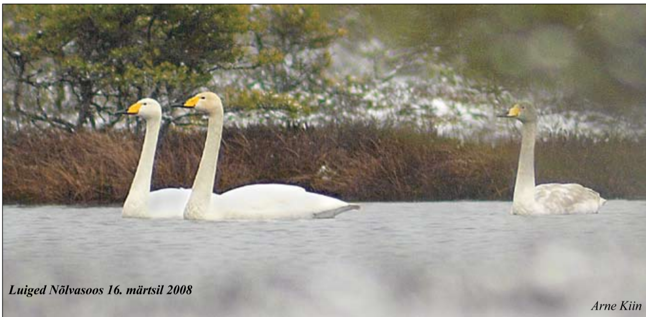
Luiged Nõlvasoos 16. märtsil 2008