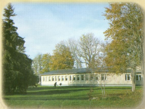
Täname Hageri koolimaja.

Täname kõiki, kes on läbi aastate Hageri kooli vaimsust kõrgel hoidnud!