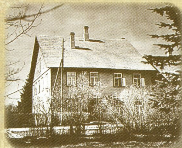
Hageri vana koolimaja.