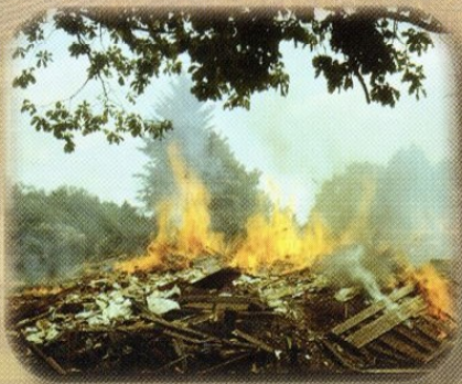
Hageri vana koolimaja lõpp.