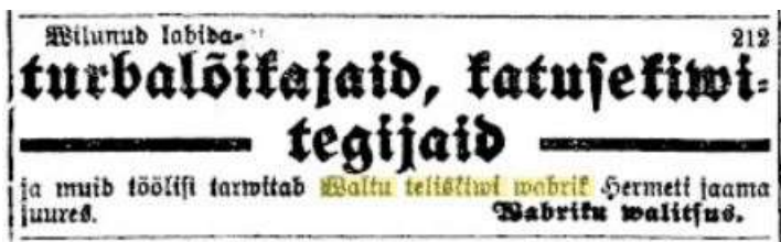
Kuulutus 22. juuni 1918 Päewaleht

teises pooles Jürna-nimeliseks tegid. Sobiks ka lihtsalt Saviangu, sest seal lähikonnas läiklevad veesilmad on pikki aastaid telliste tegemiseks savi andnud. Niisugune lugu siis, kus vallavolikogu peab otsustama, kas põlistada oma otsusega Jürna mälestus või valida üks siin pakutud variantidest. Aga otsustama peab, et asi lõpuks selge oleks.