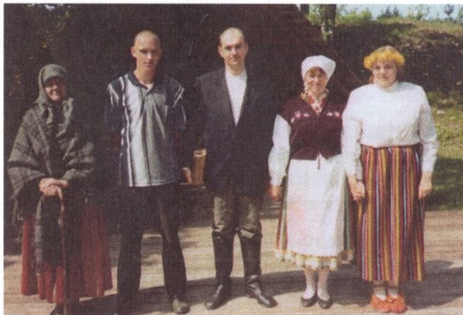
„Kuda nõiaks saada“ etendus Varbola linnusel.