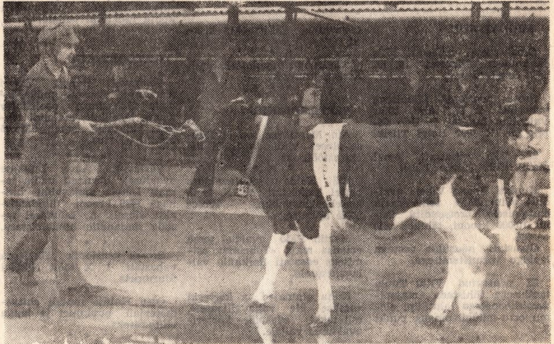
Raikküla kolhoos oma tööloomi demonstreerimas.

Administratiivpersonal suurenes 40ni, traktoriste 22, autojuhte 19, abiettevottes ja töökojas 23, ehituses 20, lüpsjaid 20, karjakuid 11, vasikatalitajaid 14, linnutalitajaid 3, seatalitajaid 7 ja taimekasvatuses 58 inimest.