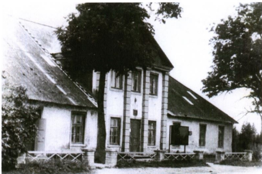
Rahvamaja eesvaade Arnoldi tehtud aiast.

2003.aastal paigutasime Haimre rahvamaja esiseinale mälestustahvli hoone tegevuse kohta ja sellele on raiutud ka Arnoldi nimi.