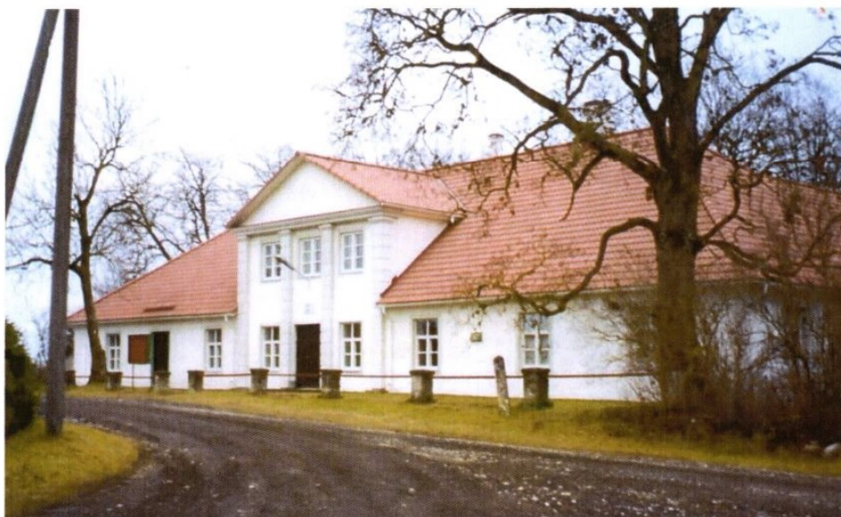
Rahvamaja eesvaade 2001.aasta novembris.