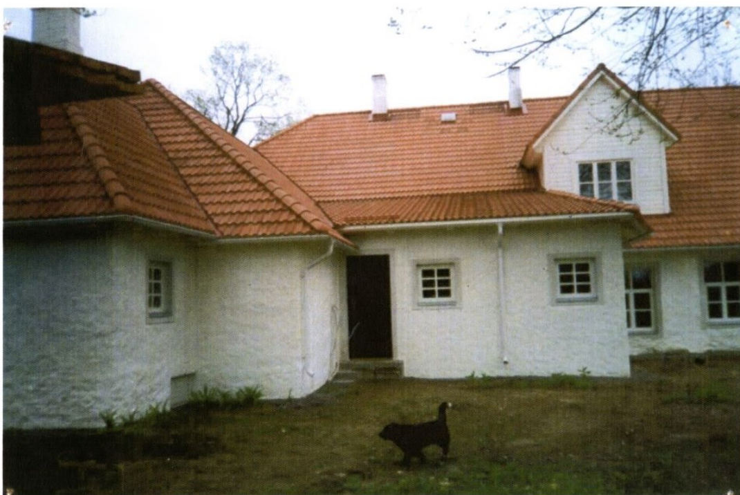
Haimre Rahvamaja tagavaade 2001.a. novembris.