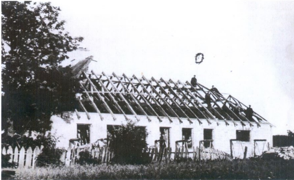
Pildil 1936.aastal rahvamaja saalipoolse osa ehitamine.