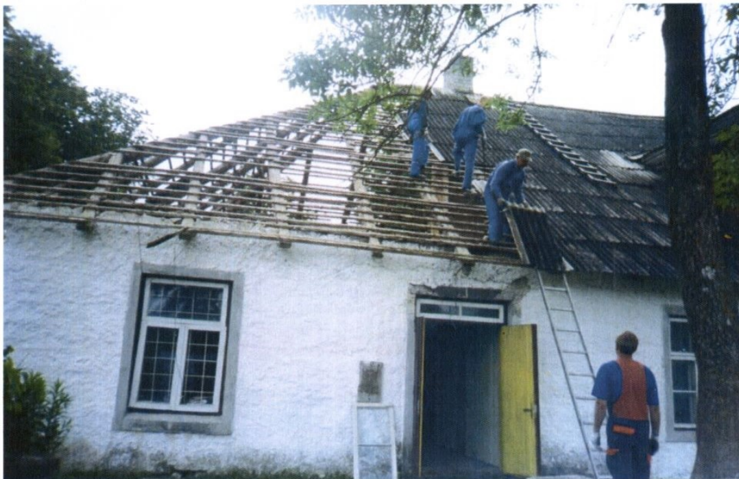
Rahvamaja vasakpoolse osa eest vaade.