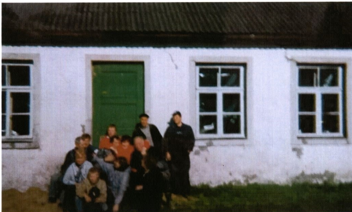
Talgulised rahvamaja saalist pargi poole väljuval uksetrepil 1999.aasta mais.