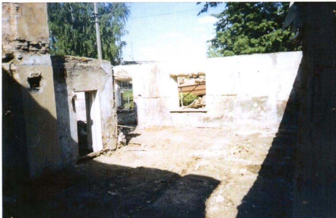
Vasakpoolne osa lammutati kuni seinteni.