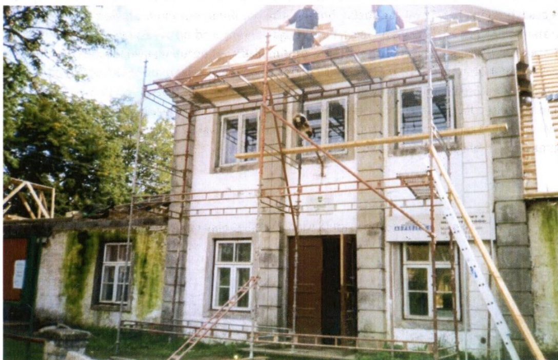
Rahvamaja renoveerimistöde algus 2001.aasta juulis .

2000.a. otsustas Märjamaa vald tellida Haimre Klubi renoveerimisprojekti.