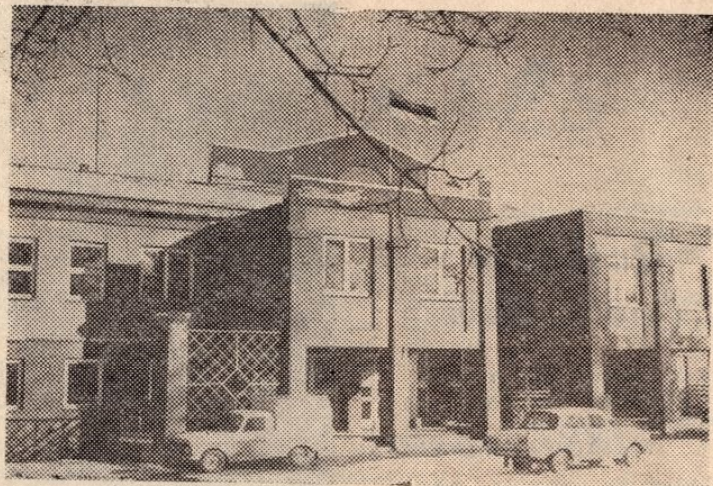
Raikküla kontorklubi 1990

Peainseneril koos kaitseliiduga tagada kontroll ja kord