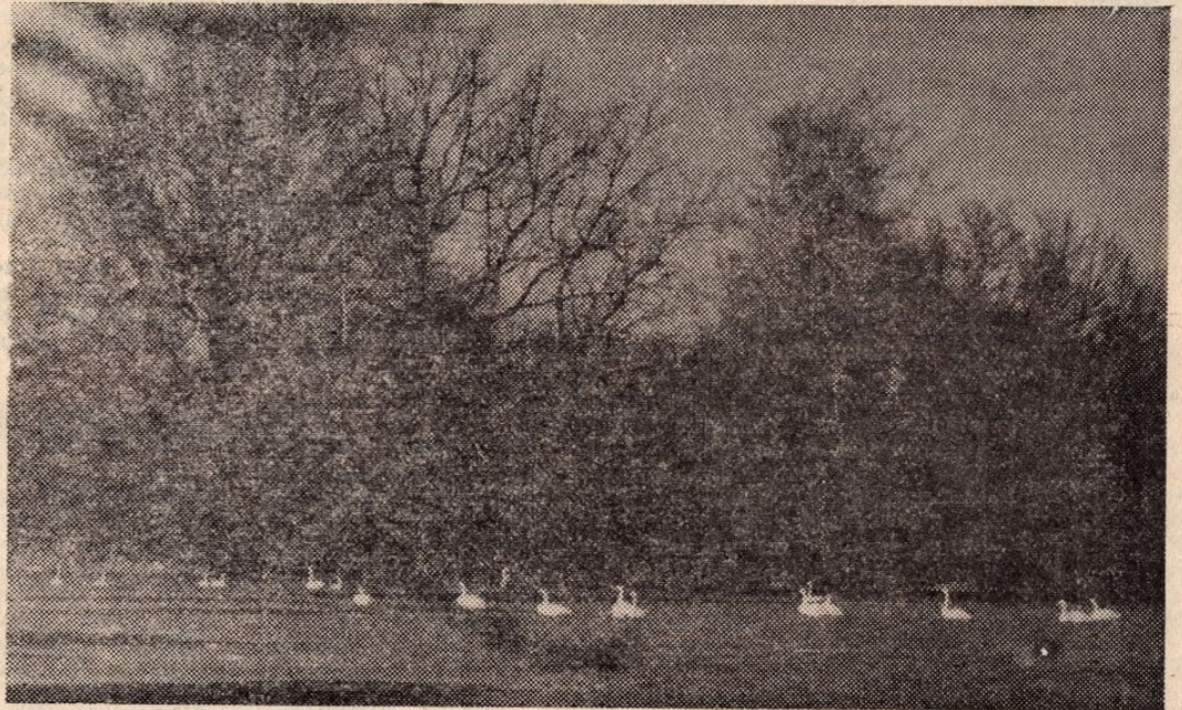
Luiged kevadel Keo küla põldudel.

Üle laane laotus luikab, kõue kõmin metsa pääl. Üle oru ootus huikab, vaimud vaat'vad mäe pääl.