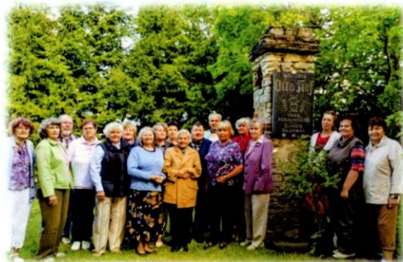
Siin oleme pildistatud Uuskülas Sildema talus Otto Tiefi sünnikohas. O. Tief oli Vabariigi valitsuse moodustaja 1944. aastal