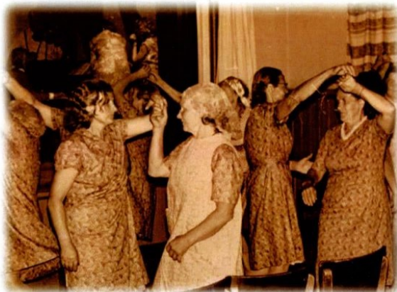
Pensionärid õppisid näitemänge, laulsid ja tantsisid vanaaegseid seltskonnatantse.