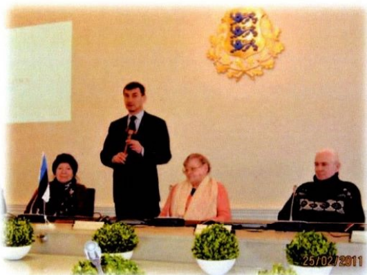
Sellel pildil on mõned meist näha Stenbocki majas, kus peaminister Ansip võttis meid lahkesti vastu.