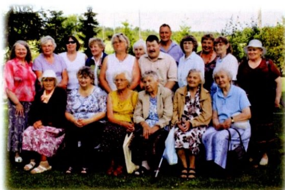
Suvised väljasõidud erivatesse paikadesse on toimunud juba viiskümmend viis aastat.