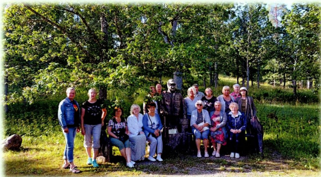
Koduläte 27. juulil 2022 Varbolas ekskursioonil

Aeg kiirelt edasi ruttab ei iial ta peatuma jää. Aastad, mil tegusad olime, kaunina hinge meil jäänd.