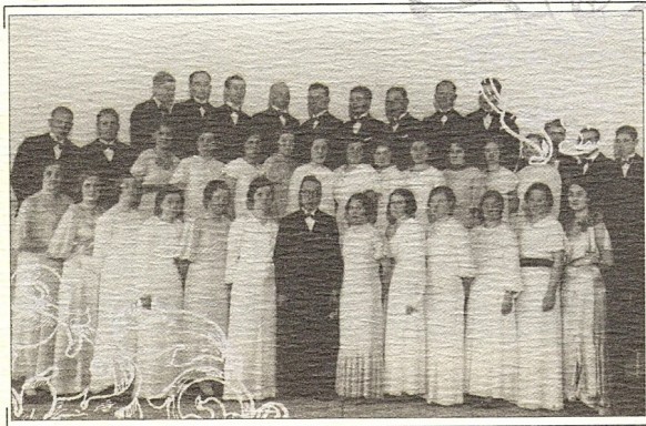
Kohila Haridusseltsi segakoor

Iseseisva vaba Eesti tugevamaks alusmüüriks on tema rahva kõrge hariduslik ja kultuuriline tase.