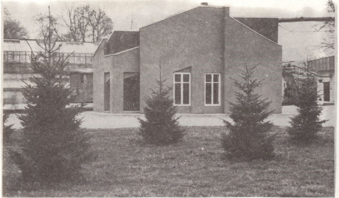
■ VALTU LIHA- JA PIIMAMÜÜGIPUNKT, ARH. TÖNIS KURISOO.

Inglise nuumikute sigala — ehitatakse uus sigalakompleks Raba tee äärde. See koosneb kahest sigalast à 100 kohta, katlamajast, söödaköögist, sõnnikumajanduse ehitistest. Olemasolev Inglise sigala rekonstrueeritakse hiljem noorloomalaudaks.