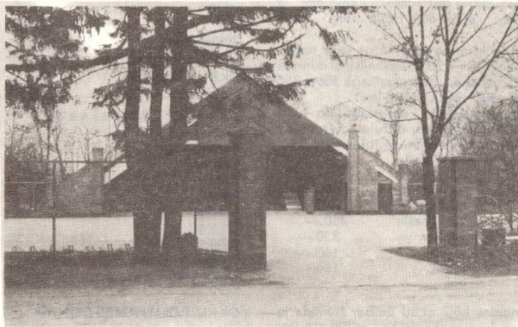
■ VALTU MÄNGUDEVÄLJAK, ARH. TÖNIS KURISOO.

Inglise töökoda — ehitatakse uus remondihall koos mitmesuguste agregaatide remondi ja tööpinkide ruumidega, kogupinnaga 1188 m 2 . Samuti ehitatakse uus olmehoone riietus-, pesemis- ning kontoriruumidega. Inglise töökoda saab ka uue katlamaja.