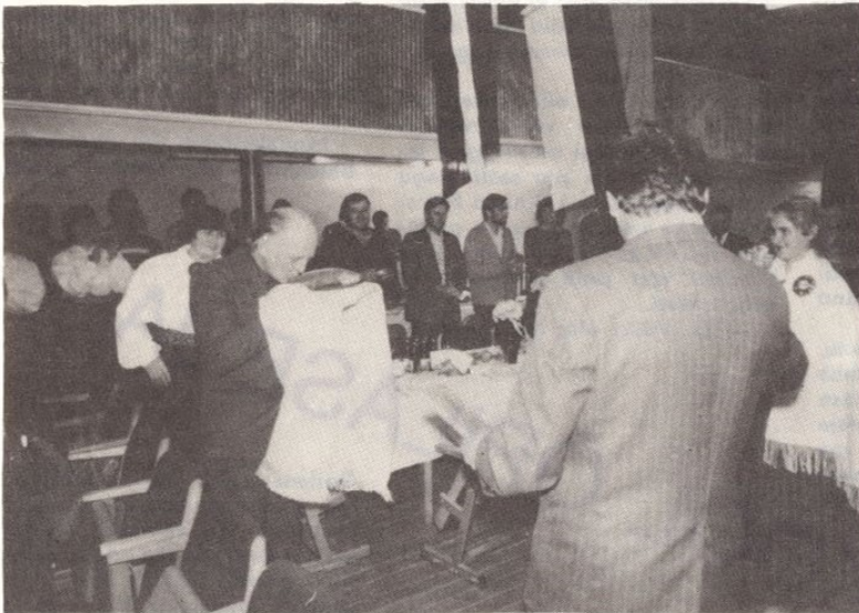
□ FOTOMEENUTUS LÄINUDAASTASEST SÕPRUSKOHTUMISEST LÄTI NSV MADONA RAJONI DŽELZAVA KOLHOOSI ISETEGEVUSLASEGA INGLISTE KLUBIS