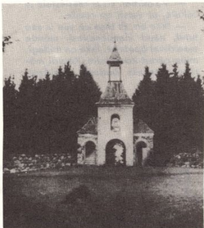
IMK sümbol — Jaalimäe kabel.