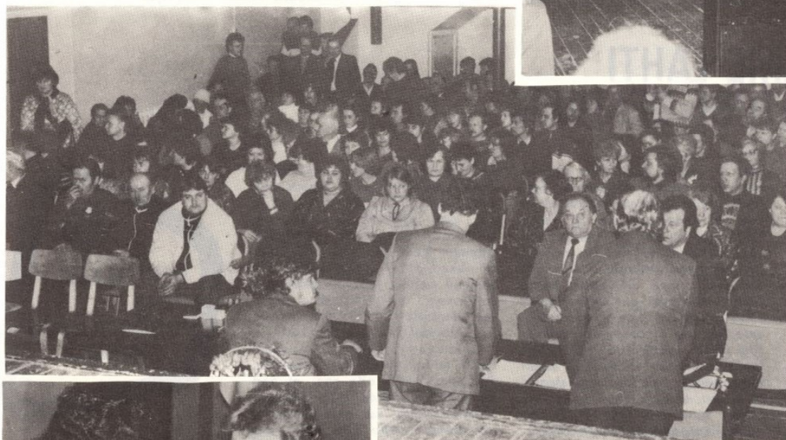
FOTOD ÜLD- KOOSOLEKULT