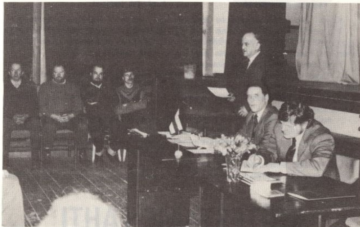
Koostanud ENDEL MALTSAR

Need mõningad võrdlusarvud aitavad meil selgust luua kuidas kujunesid 1988. a. töötulemused. Võrrelgem end teistega.