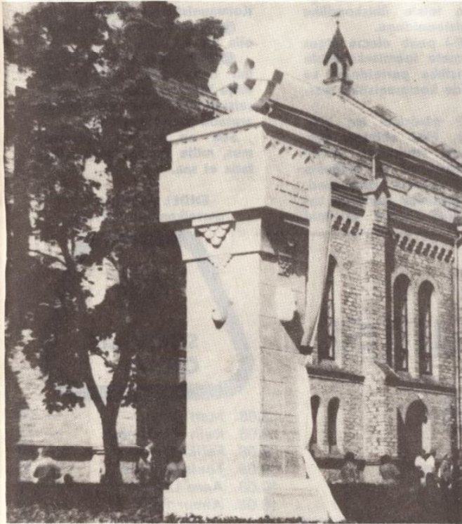
■ VÕIDUPÜHAL, 23. JUUNIL TAASAVATI RAPLA KIHELKONNA VABADUSSAMMAS.

Tuhanded kalmud, mille all puhkavad Vabadussõja kangelased, kes ohverdasid elu selleks, et meie rahus elada võiksime, et Eesti oleks jäädavalt vaba ja iseseisev, need kalmud kutsuvad meid tänna enam kui üalgi enne töötama ja lubama, et tahame kindlustada ja kaitsta oma vabadust ja iseseisvust, tahame hoida rahu.