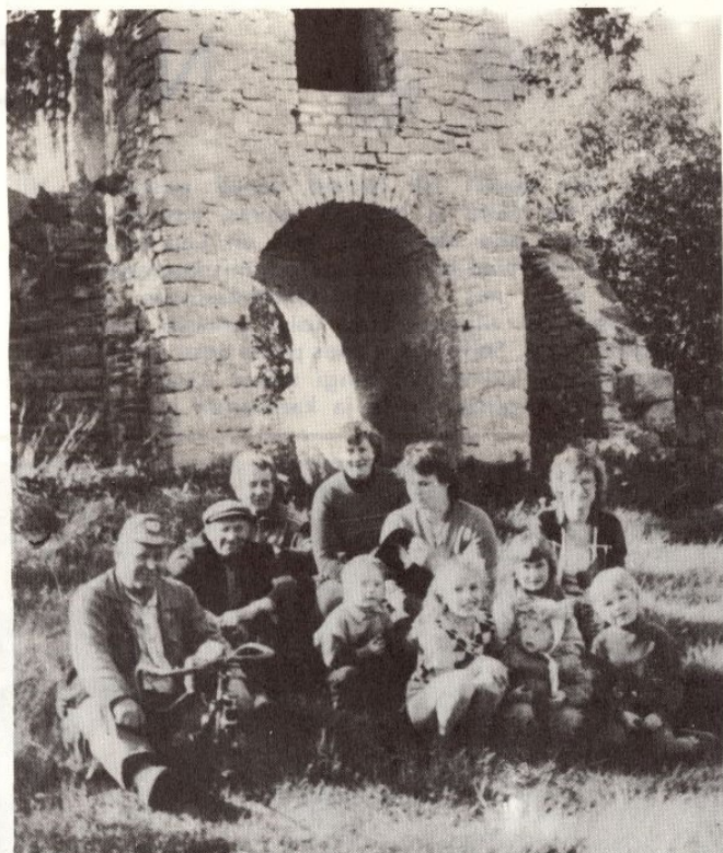
■ GRUPP HEAKORRATÕDEST OSAVÕTJAJD JAALI- MÄEL.