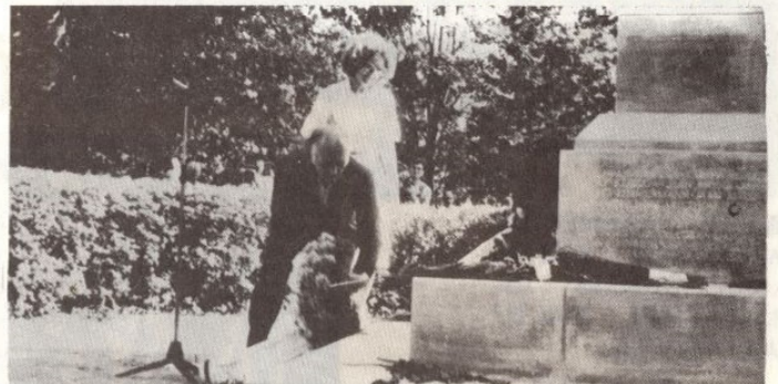
■ TENNO TEETS ASETAS VABADUSSAMBA JALAMILE PÄRJA RAPLAMAA RAHVARINDE POOLT.