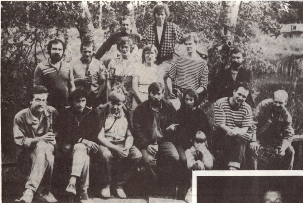
■ KOOS GRAAFIKUTEGA.