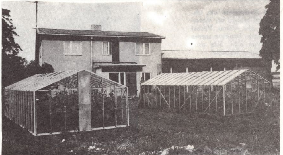
● Saueaugu on muutunud tundmatuseni. Praegu elavad siin vanaperenaine Elizaveta Valge ja tütar ning väimees perega.