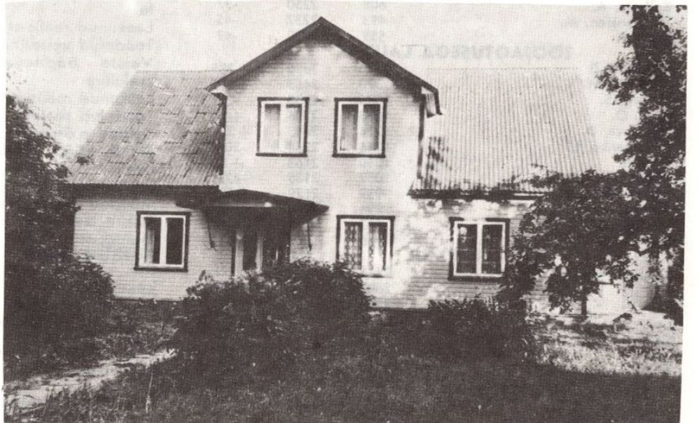
● Kruusimäe on Põd- rade kodu. Talu sai valmis 1929. Praegu on siin kas- vamas vanaperenaise Emilie tütretütrepöeg Rein Uustalu.