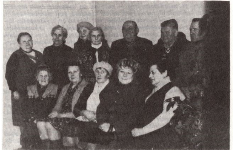
Vaadati läbi ja esitati üldkoosolekule kinnitamiseks kandidatuurid au- ja teenelise kolhoosniku aunimetuse omistamiseks.