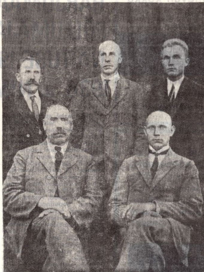
Inglise Põllumeeste Kogu Juhatus.