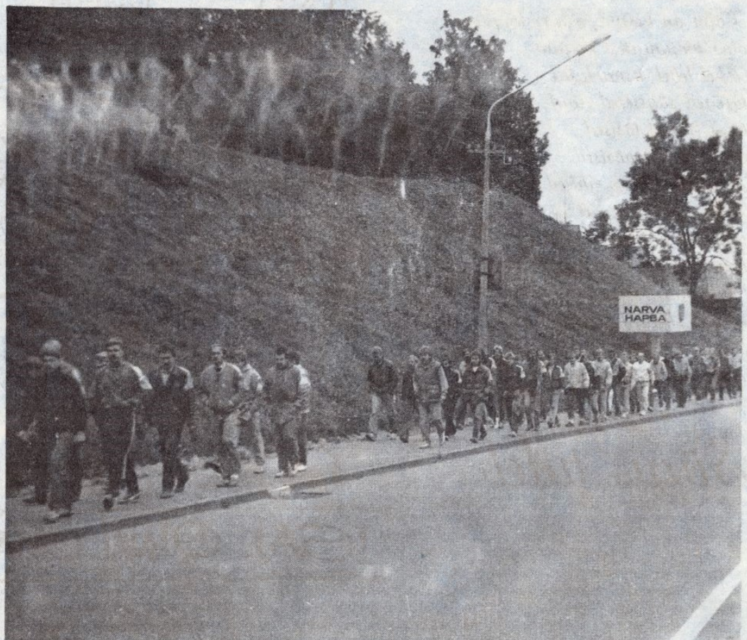
● Grupp piiriõppustes osalenud Inglise ja Valtu kaitseliitlasi Narvas 2. septembri hommikul.

2. septembril toimus Kaitseliidu laiendatud staabiõppus koondnimetuse „Riigipiir '90" all. Aktsiooni käigus paigaldati piiripostid 1920. a. Tartu rahulepinguga sätestatud piirides.