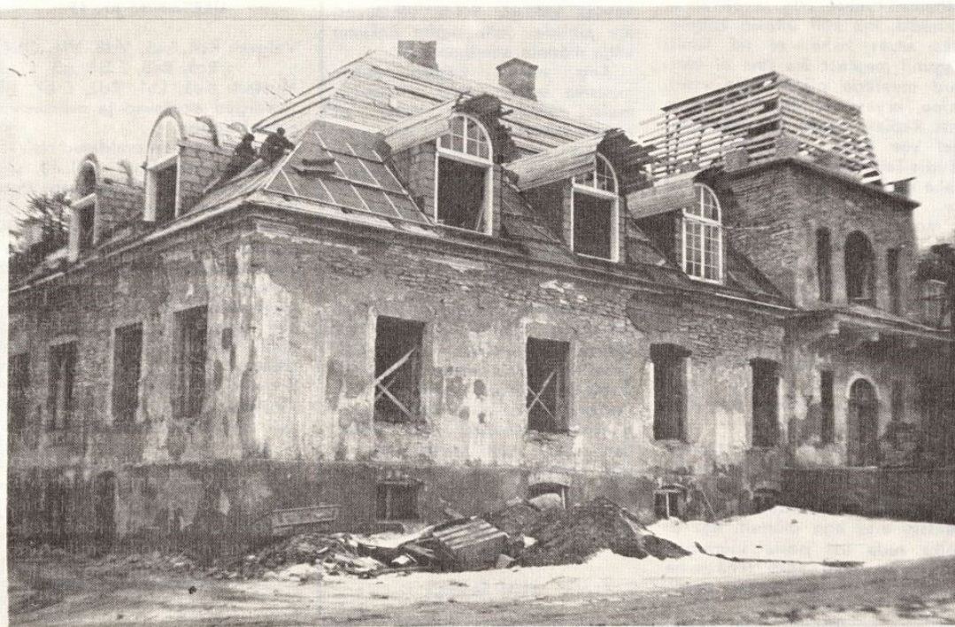
○ Inglise mõis jaanuaris 1990.

V. POPOV, Rapla Rajooni Sanitaar-Epidemioloogiajaama pears