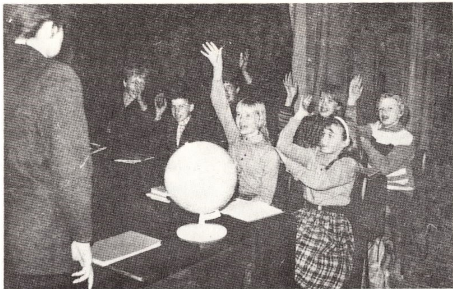
„Hakka või uskuma“ esietendus Inglise klubis.