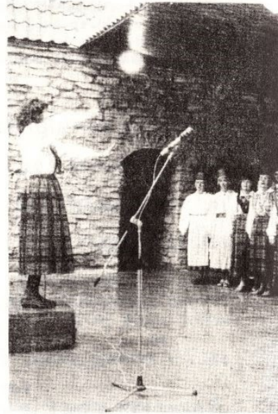
● Esinevad segakoord

Foto meenutusi 16. juunil toimunud VI Valtu- Inglise laulu- peost