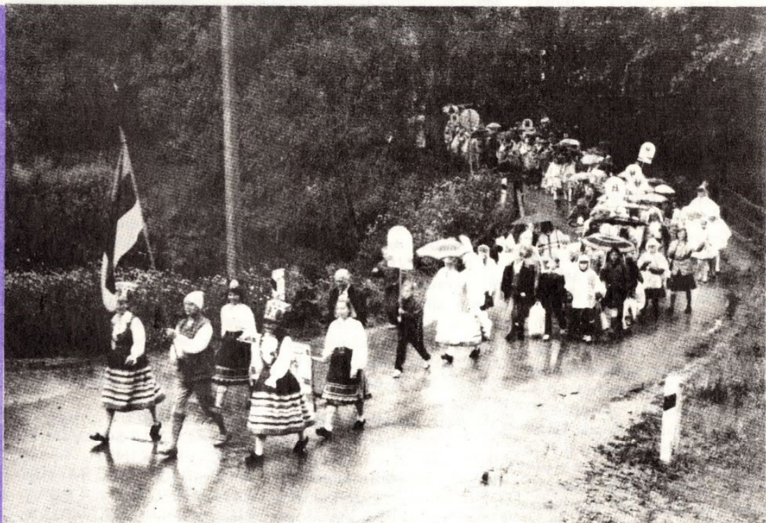
● Läheme, läheme tantsimaie... Läheme, läheme laulemaie...