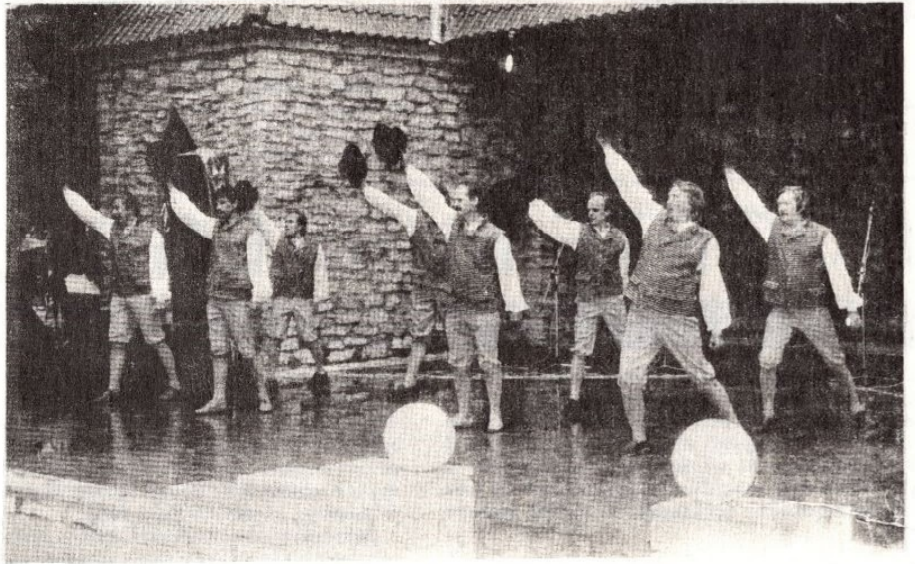
● Iga mees on oma saatuse sepp ja oma õnne valaja...