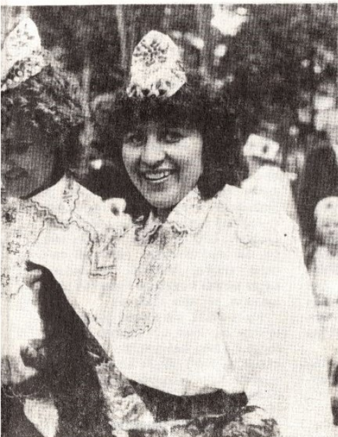
● Rahvatantsija näol on alati naeratus, ka sel- lel vihmasel laulupeol