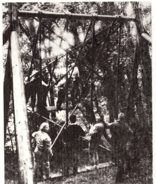
● Jäägu see kiik, eesti rahvapidude lahutamatu osa, meenutama kuen- dat ja kutsuma seitsmen- dale Valtu-Ingliste lau- lupeole