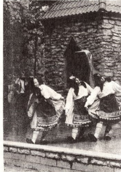
● Naisrühmalt „Naiste päev“