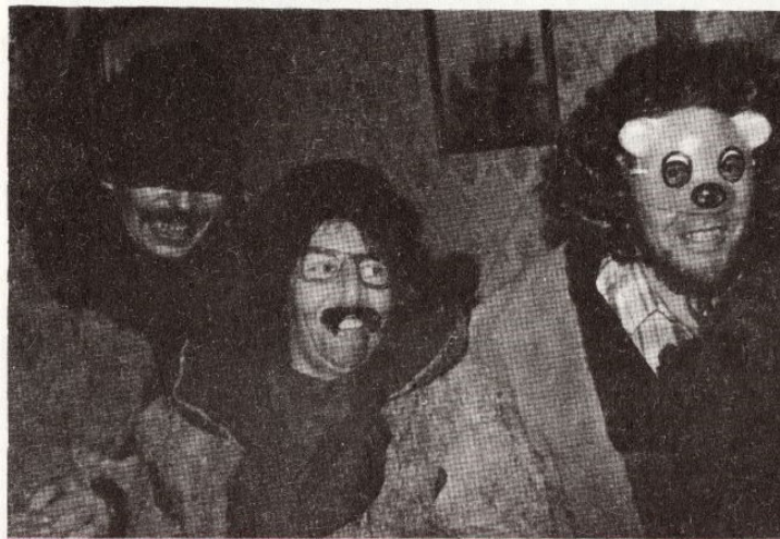
MART SANDI fotoreportaaž sündmuskohtadelt.