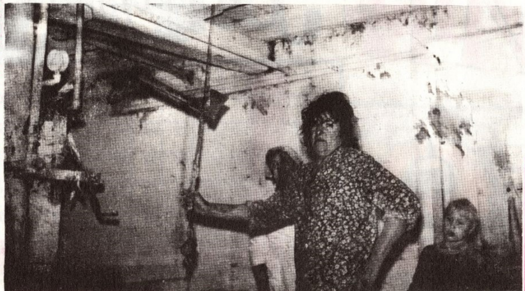
Võistlusfoto nr. 1 "Raske on, aga elada tuleb." Märgusõna "HÄMARIK"

Möödumas on aasta oma hüvede ja pahe- dega. Käes on saak, mis olenes loodusest ja hool- susest. Ehk on aastavahetusel õige aeg mõelda ka neile, kellega koos harime hingepõldu, mõelda neile, kellega koos laulame, mängime, tantsime, punume korve või koome ning õmbleme.