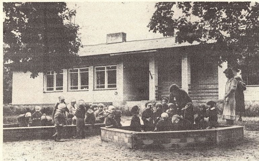
Mudilaste päev möödub lasteaias.

Alates 1979.a. novembrist tegutseb komsomolialgorganisatsiooni eestvedamisel majandis noorteklubi, mis on vaatamata oma lühikesele eksisteerimisajale kohalike noorte hulgas hästi populaarseks saanud.