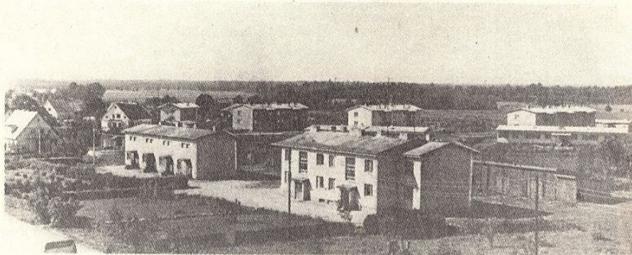
Vaade keskuse elamutele.