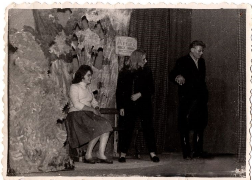
Pildid 1962. aastal lavastusest näitemängust E.Ranneti „HANED“.