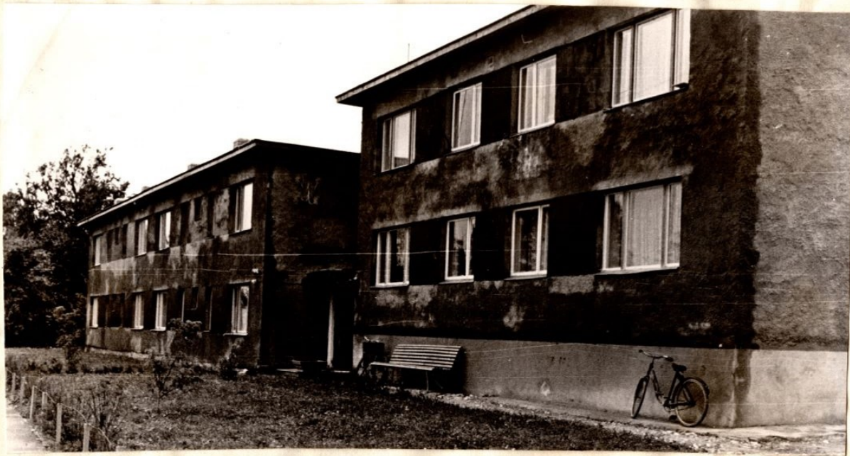
12 korteriga elumaja Rapla KKK-i Märjamaa jaoskonnas ehitatud ja töelistele.