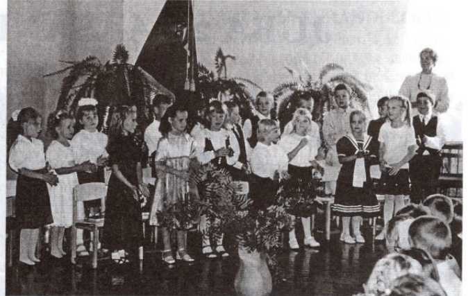
2002. õppeaastal alustasid koolitööd 19 tüdrukut ja poissi

Valtu kooliõpetajad tervitavad kooli aastapäeva puhul oma endisi kolleege ja vilistlasi; praegusi õpilasi ning nende vanemaid ja soovivad, et säiliks meie sõbralik koostöö, püsiks kooli hea nimi ja OMADARMSAD TRADITSIOONID!