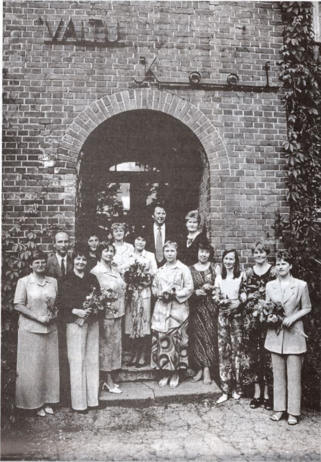
Õpetajad 2002.a kevadel

Õpilasi 206 (102 poissi ja 104 tüdrukut)