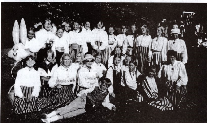
Valtu lapsed ei taha vahele jätta ühtegi laulupidu