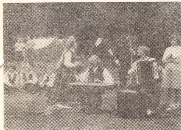
Meie tantsijate ja pillimeeste esinemised ei katke suvelgi. Lustakas kontsert anti EKE aktiiv-päeval Paekülas.