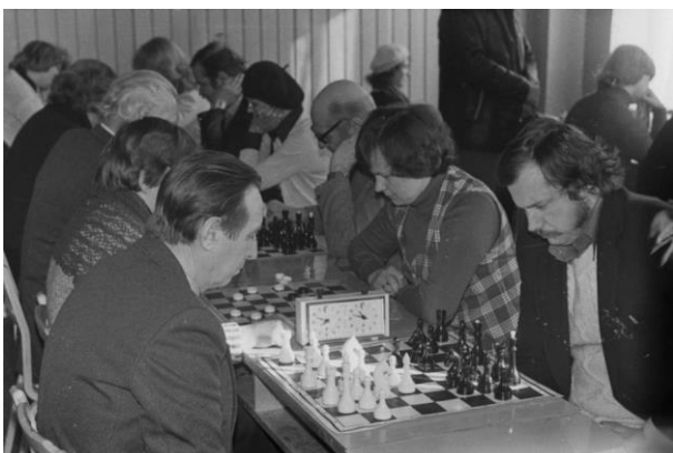
Malevõistlus Kasari mängudel 1979