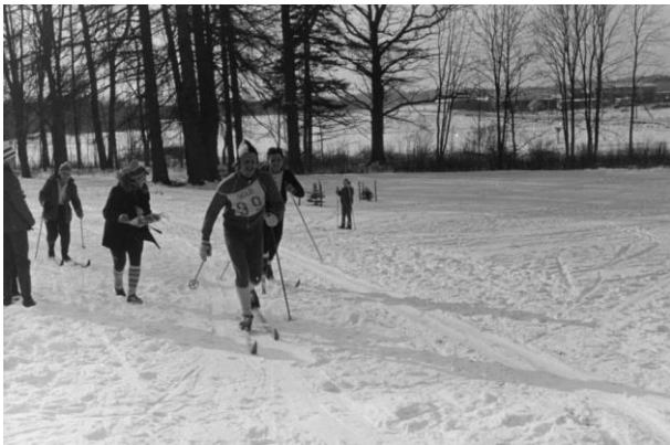
Kasari mängude suusavõistlus Valgu pargis 1983