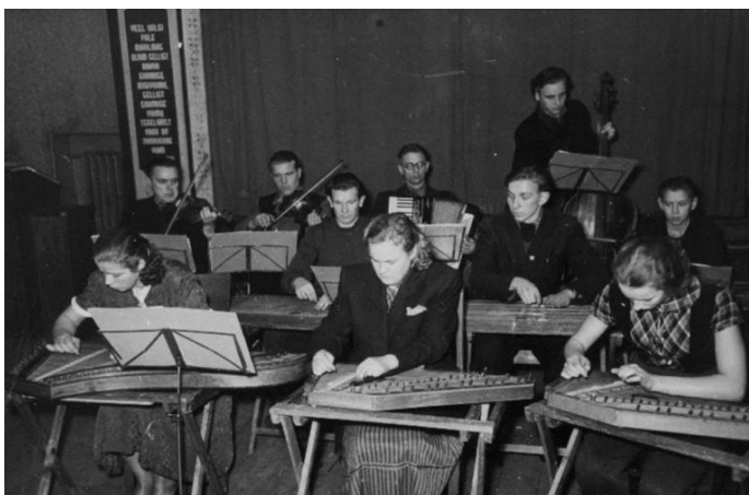
Vigala rahvamaja rahvapilliorkester harjutamas 1956. a