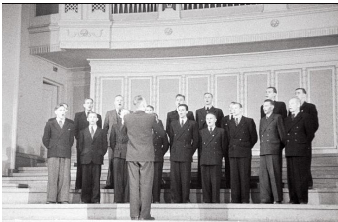
Märjamaa meeskoor esinemas ametiühingute vabariiklikul ülevaatusel 1951. a