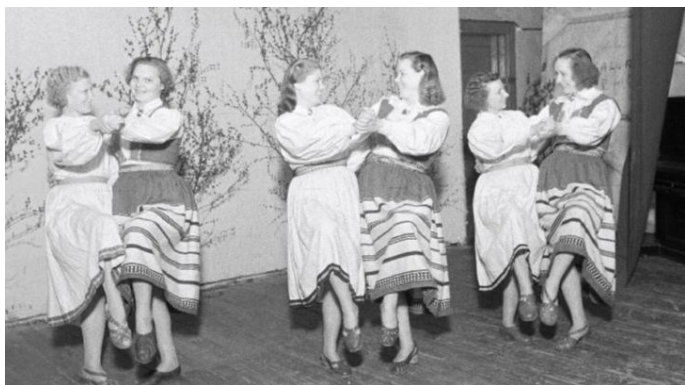
Märjamaa rajooni rahvamaja naisrühm rahvatantsu õppimas 1956. a