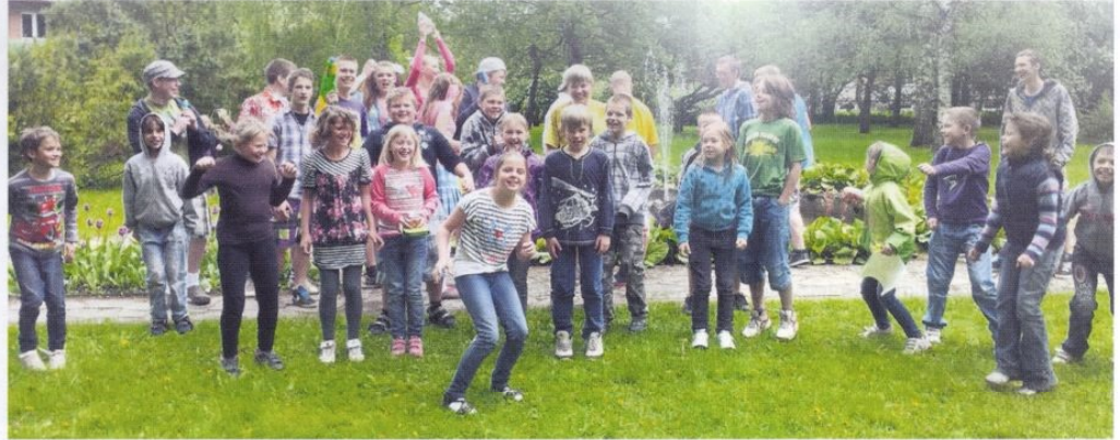
Lõbusad viimased koolipäevad.

Suviti on mitmel korral korraldatud kirbuturgu, mis on minu arvates väga hea mõte. Olen ise käinud seal ning paljudeks müüjateks on olnud lapsed. Tore, kui saab müüa maha oma vanad as-