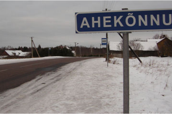
Kas see külatähis märgib ka tulevikus naabervalla piiri?

Traditsiooniliselt käsitleme aasta algul Järvakandi ja lähikülade olukorda haldusreformi hetkeseisust lähtudes. Esmalt pilguheit mäluväärs-kenduseks tagasi.