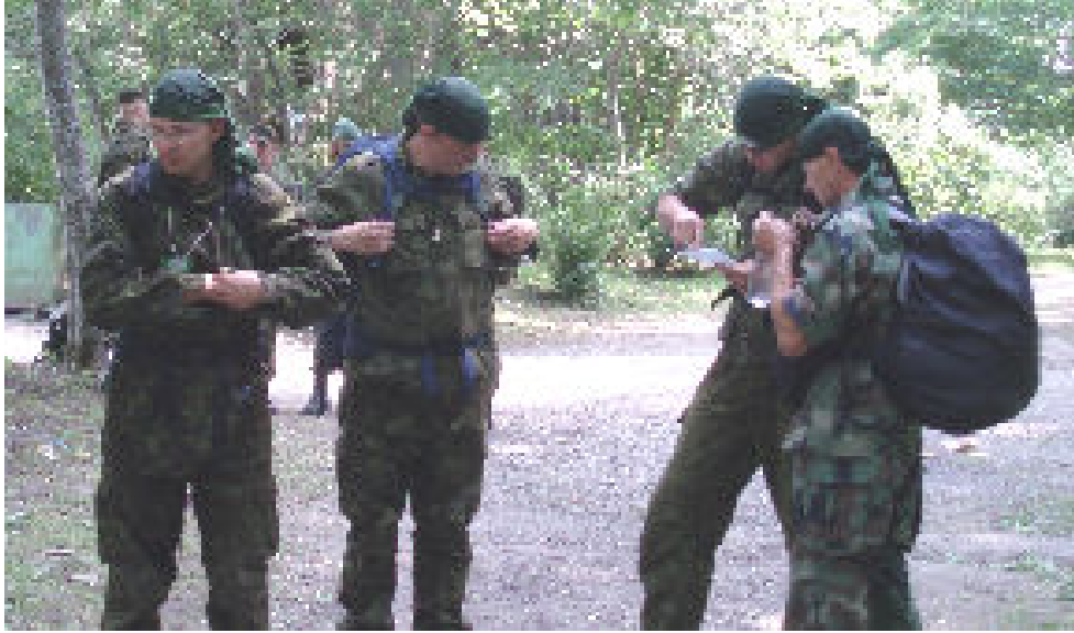
Hetk võistlusmatkalt.

Kolme aasta eest oktoobris kogunes rahvamaja seltskond noori mehi, kelle eesmärgiks oli Järvakandi noorkotkaste rühma moodustamine. Mõeldud - tehtud!