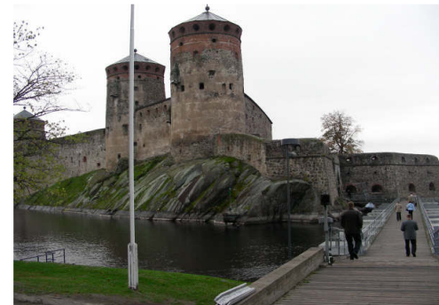
Savonlinnas kultuurielamust saamas.

Meeldejäädavaks kujunes reisi mittetöine osa. Unustamatu mulje jätsid mõned kultuurilased kõrvalpõiked: Savonlinnas kunagist Rootsi riigi idapiiri kaitsnud Olavilinna kindlus, ringsõit Imatras Soome veerikkaima jõe (Saima järvestu vee Laadogasse viija) kallastel ja Kotka linnapargid oma koskede ja skulptuuridega. Et Kotkal on nüüd laevaühendus Sillamäega, siis soovitan paljalt järgmisel suvel Kotkaga tutvumisreis ette võtta.