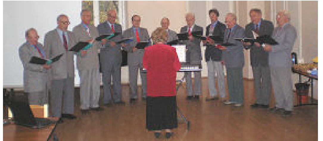
Tänuüritusel Tohisoo mõisas pakkus meeoluka kontserdi meesansambel Viisitiimi.