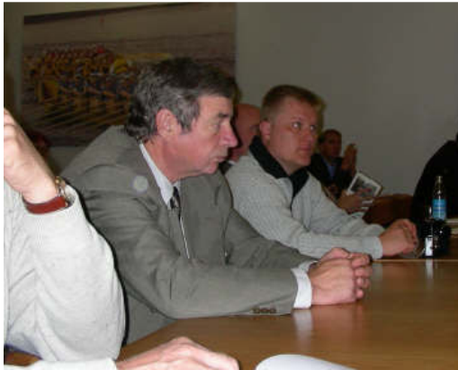
Allakirjutatu Soomes töökogemusi omandamas