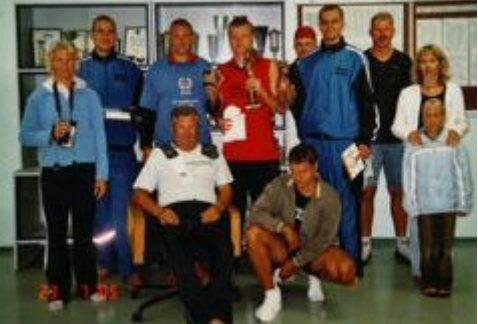
Läänemaa kümnevõistluse kohtunikud ja osalejad.