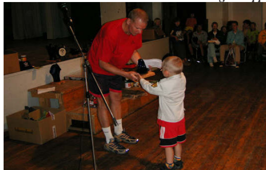
Hetk XIX alevijooksu autasustamiselt.