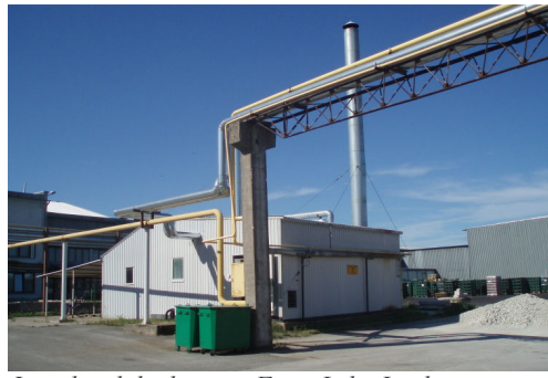
Järvakandi katlamaja.

Tulevast kütteperioodist ootab Eesti elanikke ees veel kopsakam soojahinna tõus, mis sõltuvalt soojatootja poolt kasutatavast küteliigist võib ulatuda 50-70 %-ni.