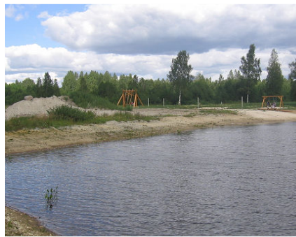
Sulleri supluskoht.

Ka jaanipäeva paiku Sulleri supluskoht avastatud õli-reostuses näeb Keskkonnaamet maakonnaleht Nädaline (vt nr 73, 29. juuni 2006) andmeil reostuse ühe võimaliku põhjustajana mõnd siinset ettevõtet. Samas ei välista ametnikud ka mõnd vana reostust, mis nüüd vette imbuma hakkas. Võimaliku jätkuva reostuse vältimiseks paigutati jõe suubuva kraavi suudmesse õlikogujad.