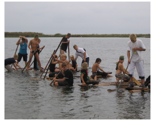
Pivarootsi parverallil.

Viiendat korda said meie valla noortelaagris kokku need, kel vajadus koolivaheaega muuta põnevamaks ja vaheldusrikkamaks. Seekord 16. - 20. juulini toimunud ettevõt-