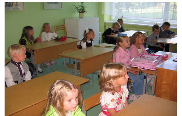
Esimene klass oma esimeses tunnis