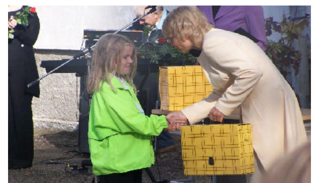
Koolijutsikohvrit ja õnnitlusi vastu võtmas