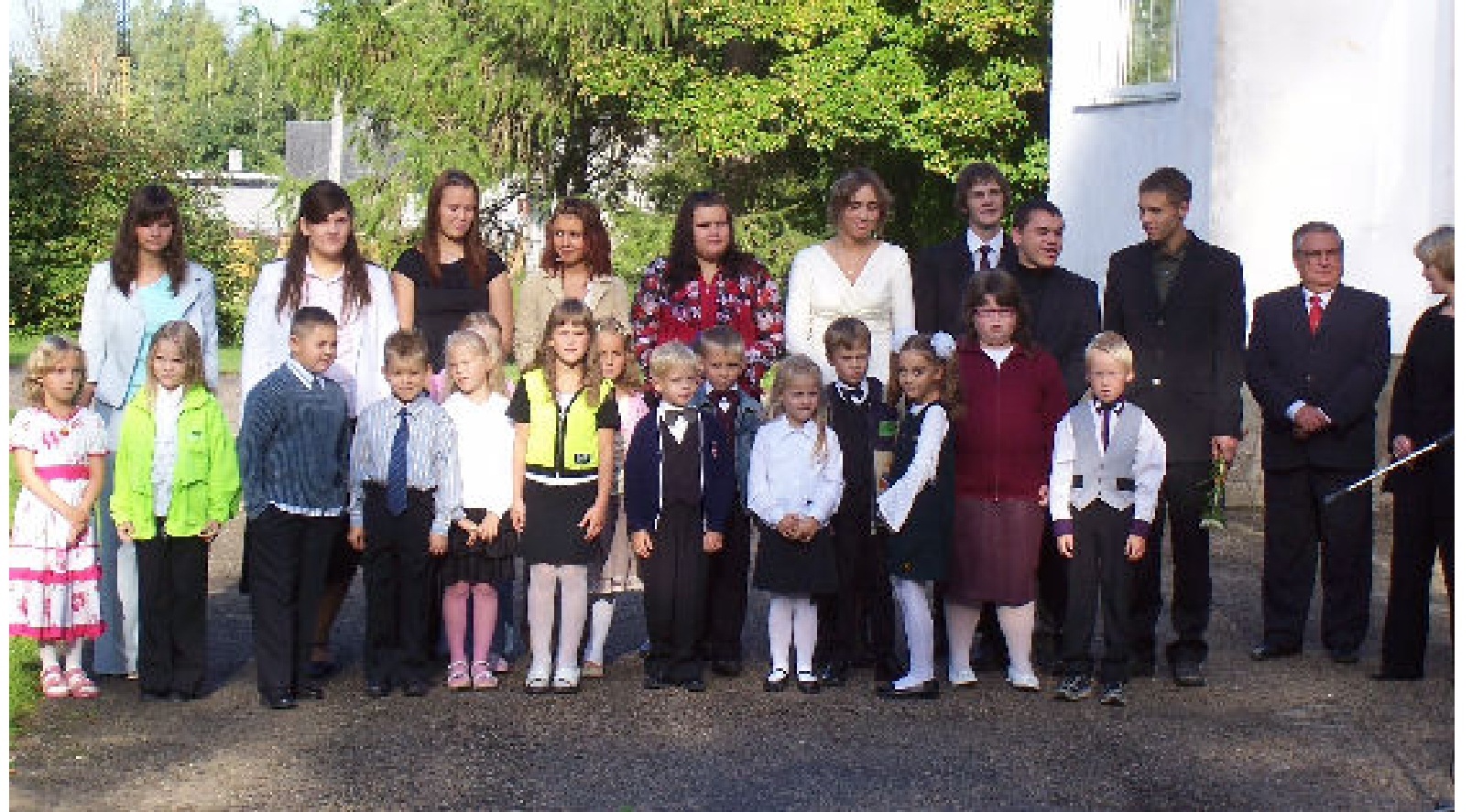
Esimene klass koos abiturientidega