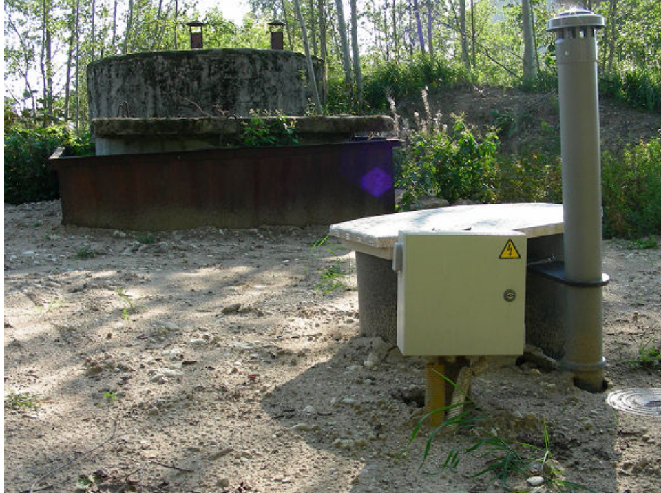
Uus ülepumpla (esiplaanil) peaks lahendama Järvakandi tööstusterritooriumi heitveeprobleemi

Käesolev artikkel on hilinenud reageering kirjatöödele jaanipäevasest õlireostusest Nurtu jõe tulevasel ujumiskohal vallalehes ja maakonnalehes.