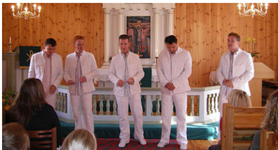
Noorkuu kontserti andmas