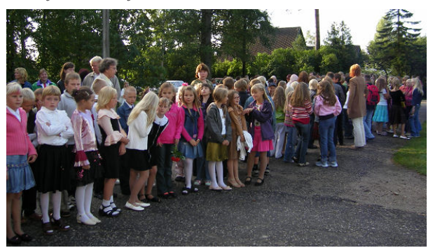
Koolipere aktusel