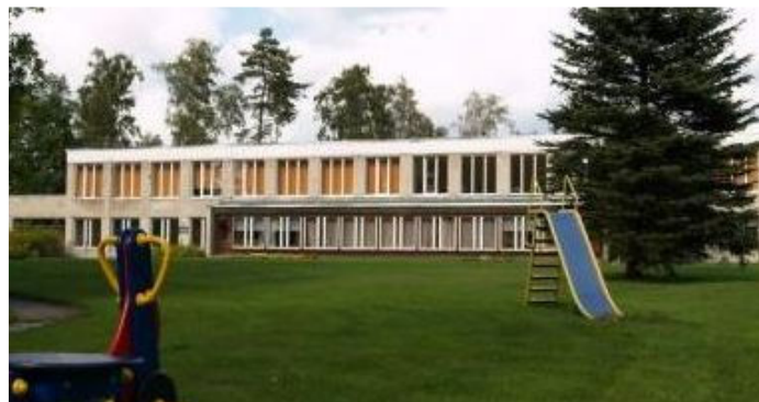
Lasteaed enne...

Tänavusel aastal muutus põhjalikult Lasteaed „Pesamuna” välisilme. Kuid palju töid tehti ära ka hoone sees.