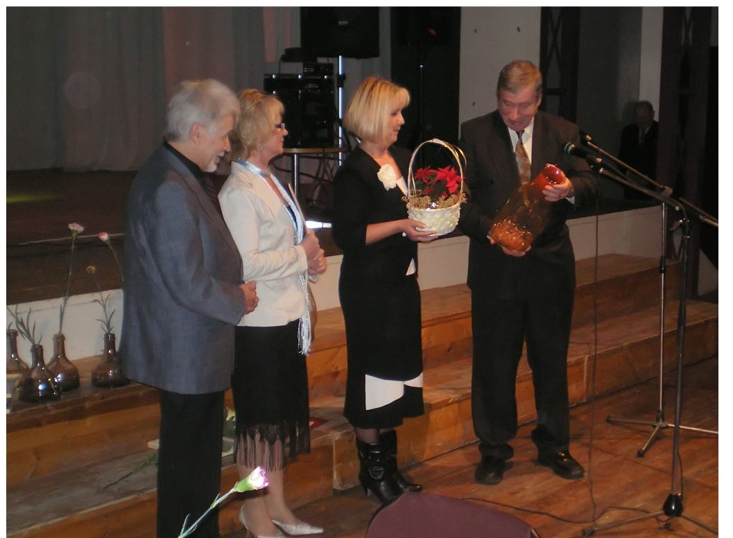
Järvakandi Gümnaasiumi esindajad rahvamaja töötajaid õnnitlemas.