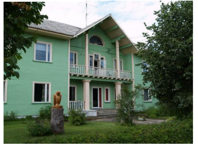
Järvakandi Hooldekodus renoveeriti tänavu elektrisüsteem, peagi alustatakse uue korpuse planeerimisega.

Vallamajagi sai uued vee- ja soojatransid ning uue sooja-