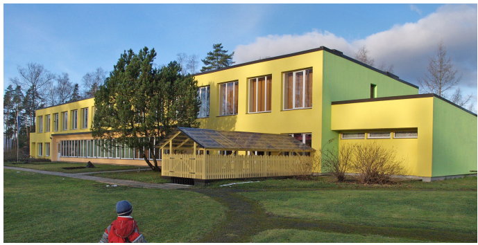
... ja pärast renoveerimistööid.

Kogu remondi vältel ei katkenud lasteaia igapäevane tegevus. Võib vaid imetleda lasteaia personali kannatlikku meelt ning vastupidavust, sest pidid nad ju päevast-päeva taluma lakkamatut kopsimist, kolkimist ning loomulikult vältimatut tolmu. Aitäh Teile kõigile selle eest.