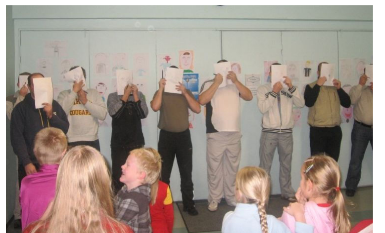
Naeruteraapia koolis.

Korraldajad - läbiviijad lasteaiaast Pesamuna, Tiia Hansar Järvakandi Gümnaasiumi huvijuht