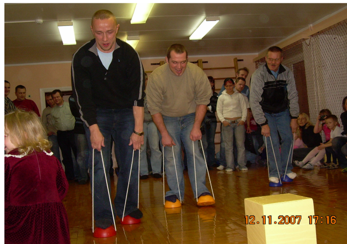
Isad lasteaia oma üldfüüsilist vormi mõõtmis.

Nagu mitmel pool maailmas tähistatakse ka Eestis novembris isadepäeva. See meile Soome kaudu tulnud traditsioon sai alguse 1910. aastal Ameerikas.