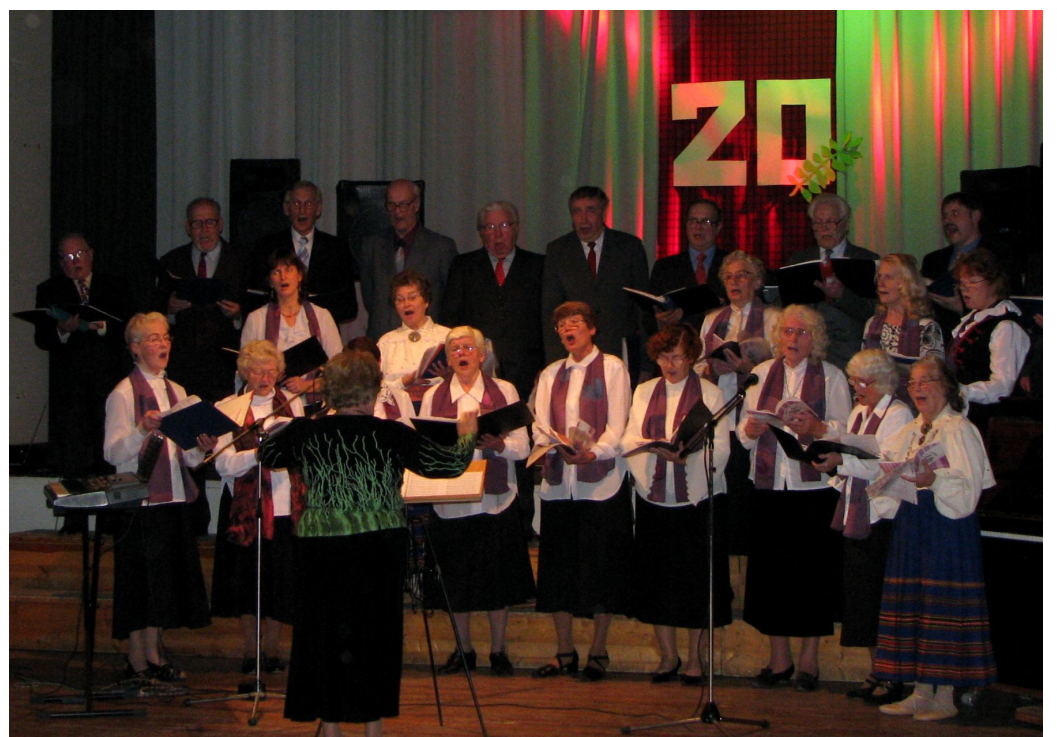
Tänavu 104. tegevusaastat tähistav Järvakandi segakoor laululil pakkumas.