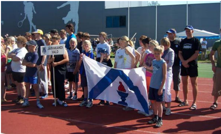
Järvakandi valla esindus maakonna suvemängudel Kohilas.