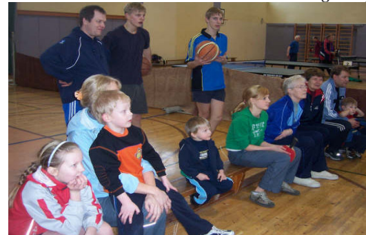
Perespordipäevalised autasustamist jälgimas