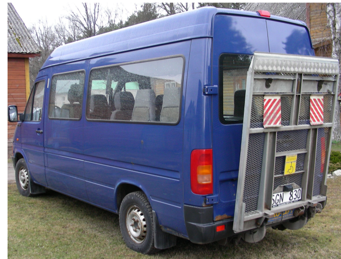
Hooldekodu buss on varustatud ka invatõstukiga.

Seoses hooldekodu ligi kahekümneaastase vanusega sõiduauto Opel Rekord lõpliku amortiseerumisega tekkis vajadus uue liiklusvahendi soetamiseks. Vaja oli just sõidukit, millega on võimalik ka ratastoolihaigeid ja invalide transportida.