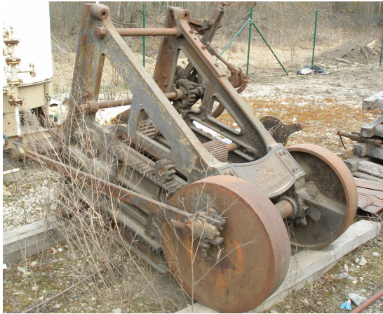
Siin, Imavere saeveski territooriumil, ootas "Original Burengatter" pea 5 aastat oma saatust. Täna on ta Järvakandi Klaasimuuseumi eksponaat ja vajab restaureerimist.