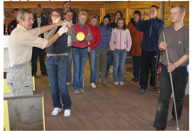
Vaivara kooli õpilased peale klaasimuuseumi muuseumitundi puhumispiipu proovimas.

Klaasipuhumist ja esemete valmistamist on klaasimeistri juhendamisel võimalik proovida ka muuseumi külastajatel. Puhumisproov on muuseumipileti ostmisele tasuta (siiski valib grupp endi seast vaid ühe õnneliku), kuid kui soovitakse klaasist midagi keerukamat valmistada, tuleb töötunni eest (juhendamiseks) kulude katteks tasuda 1000 krooni. Klaasiesemete valmimist saab klaasikojas jälgida tööpäeviti peamiselt ennelõunal ja vahel ka laupäeviti.