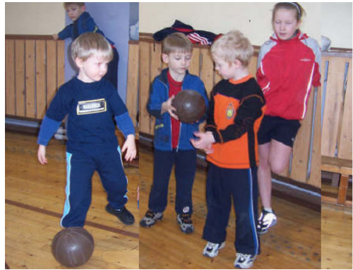
Osavust mõõdeti nii keeglirajal...

17. märtsil peeti võimlas aga toredat kogu pere spordipäeva, mille sees oli lauatennisevõistlus „Lahtine laud” ja osavusmängud kõikidele vanusegruppidele.